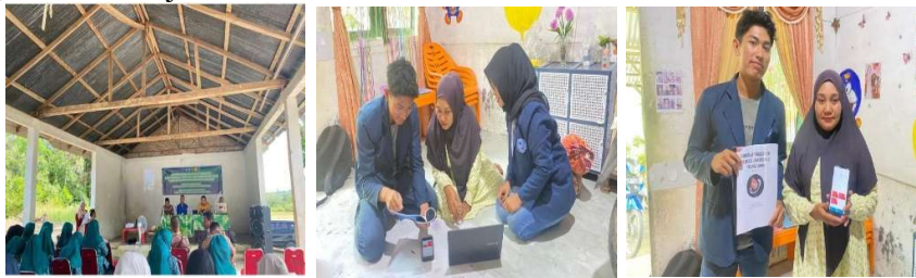
Gambar 1. Dokumentasi Kegiatan

Buku panduan penggunaan Lamikro merupakan media pendukung yang disusun untuk membantu pelaku UMKM memahami cara mengoperasikan aplikasi Lamikro secara mudah dan sistematis. Buku ini memuat penjelasan mengenai langkah-langkah instalasi aplikasi, proses pembuatan akun, pengenalan fitur-fitur utama, hingga tata cara pencatatan transaksi dan penyusunan laporan keuangan sesuai dengan SAK EMKM. Dengan adanya buku panduan ini, pelaku UMKM diharapkan dapat mempraktikkan penggunaan aplikasi secara mandiri, sehingga pencatatan keuangan usaha dapat dilakukan secara lebih tertib, akurat, dan berkelanjutan.