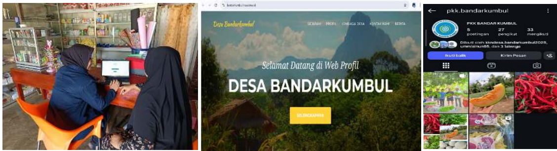
Gambar 1. Dokumentasi Kegiatan

Pelaksanaan kegiatan optimalisasi pemanfaatan media sosial dan Web Desa di Desa Bandar Kumbul menunjukkan hasil yang cukup positif. Kegiatan yang dilakukan melalui tahapan sosialisasi dan pendampingan bisa mendorong pemahaman sekaligus keterampilan masyarakat dalam memanfaatkan teknologi digital sebagai sarana promosi usaha dan pengembangan ekonomi desa.