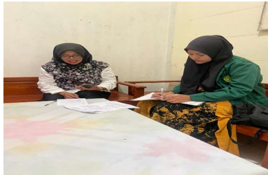
Gambar 1. Wawancara bersama Kepala Sekolah MI Nihayaturroghibin

Hasil penelitian menunjukkan bahwa implementasi STEAM di MI Nihayaturroghibin didukung oleh kebijakan sekolah yang mengintegrasikan STEAM dalam kurikulum, pengembangan kompetensi guru melalui workshop, penyediaan fasilitas pembelajaran (LCD, laptop, bahan proyek, alat seni), serta fleksibilitas ruang kelas. Kepala sekolah menyatakan bahwa STEAM dipandang sebagai strategi untuk menyiapkan siswa menghadapi tantangan abad ke-21 melalui pembelajaran yang praktis dan kontekstual. Dukungan ini menunjukkan bahwa penerapan STEAM tidak hanya bergantung pada guru, tetapi juga pada kebijakan institusi sekolah.