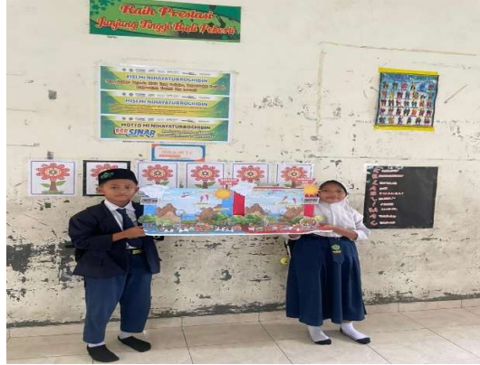
Gambar 2. Hasil Karya Diorama Siklus Air Siswa dalam Pembelajaran STEAM

Aktivitas kreatif seperti mendesain komposisi, memilih warna, dan menyusun elemen visual tidak hanya melatih keterampilan motorik halus tetapi juga membantu siswa mengekspresikan pemahaman konsep sains secara estetis. Temuan ini sejalan dengan pendapat Sanz-Camarero dkk. (2023) bahwa seni dalam STEAM berfungsi sebagai jembatan antara konsep abstrak dan representasi konkret, serta mendorong berpikir divergen (Sanz-Camarero dkk., 2023). Seni dalam STEAM berfungsi sebagai "thinking tool" yang membantu siswa memahami konsep abstrak melalui representasi visual (Marshall, 2014).