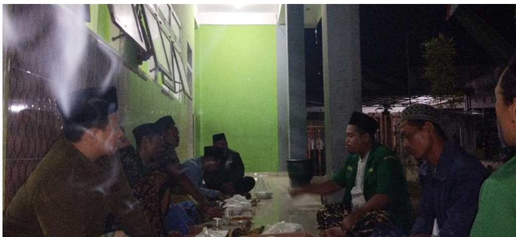
Gambar 1. Penjelasan reorganisasi dan rasionalisasi Gerakan

Masalah yang ketiga adalah kepemimpinan yang kurang sehingga mereka kurang berkumpul atau kurang melakukan diskusi secara menyeluruh atau kurang saling mengenal satu sama lainnya. Memang benar di dalam setiap organisasi itu pasti ada keberatan atau ada mungkin waktu yang tidak cukup untuk menjalankan organisasi tetapi kewajiban seorang pemimpin itu harus dan wajib dijalankan. Solusi untuk permasalahan yang ketiga ini adalah pemimpin memang harus dan mau untuk mencurahkan waktunya atau sebagian waktunya untuk menjalankan organisasi. Kenapa pemimpin kurang mampu menjalankan organisasi karena salah satunya adalah kembali lagi kepada bagaimana kesiapan seorang pemimpin. Pemimpin mengajak untuk berkumpul bersama dalam keadaan santai misal seperti cangkruan bersama ngobrol santai ataupun ngopi bareng. Hal ini penting karena dengan kita berbincang-boncang santai atau berbicara santai kita bisa menyamakan persepsi antara satu orang dengan orang yang lainnya. Apalagi sebelumnya kita tidak kenal, maka seorang pemimpin itu wajib untuk memperkenalkan dirinya. Dengan berbicara satu sama lain dapat mengetahui seluk-beluk anggota organisasinya, karakternya, dan lain sebagainya.