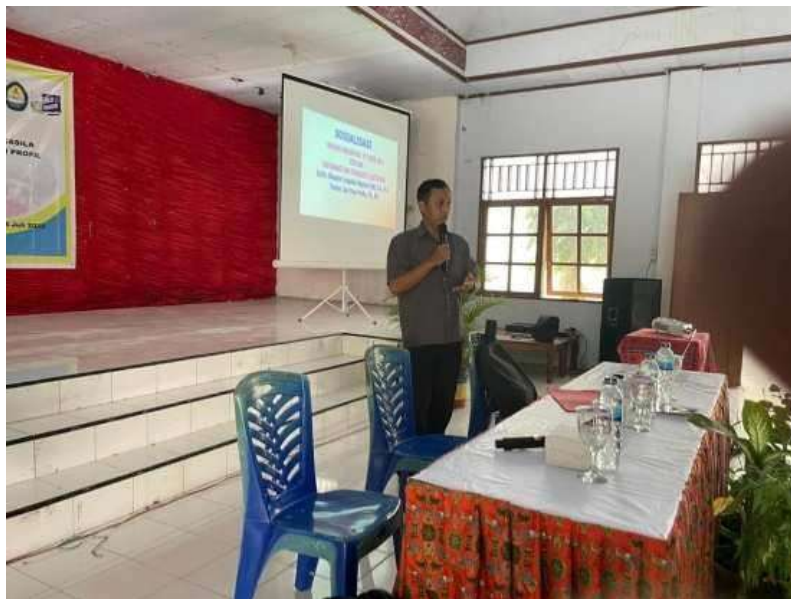
Gambar 1. Pemaparan Materi Penggunaan Media Sosial Berdasarkan Nilai-Nilai Pancasila

Pelaksanaan kegiatan pengabdian dilaksanakan di Aula SMU YPPK Taruna Darma Kotaraja dan dihadiri oleh seluruh siswa-siswi serta guru pendamping. Pengabdian memaparkan materi secara interaktif menggunakan media presentasi digital, disertai sesi tanya jawab yang antusias dari para peserta. Kegiatan pengabdian yang dilakukan bagi generasi muda dan siswa-siswi menjadi salah satu upaya dalam memaksimalkan peran penting keterlibatan generasi muda dalam bermedia sosial sehingga produktif dengan mengenali nilai-nilai Pancasila.