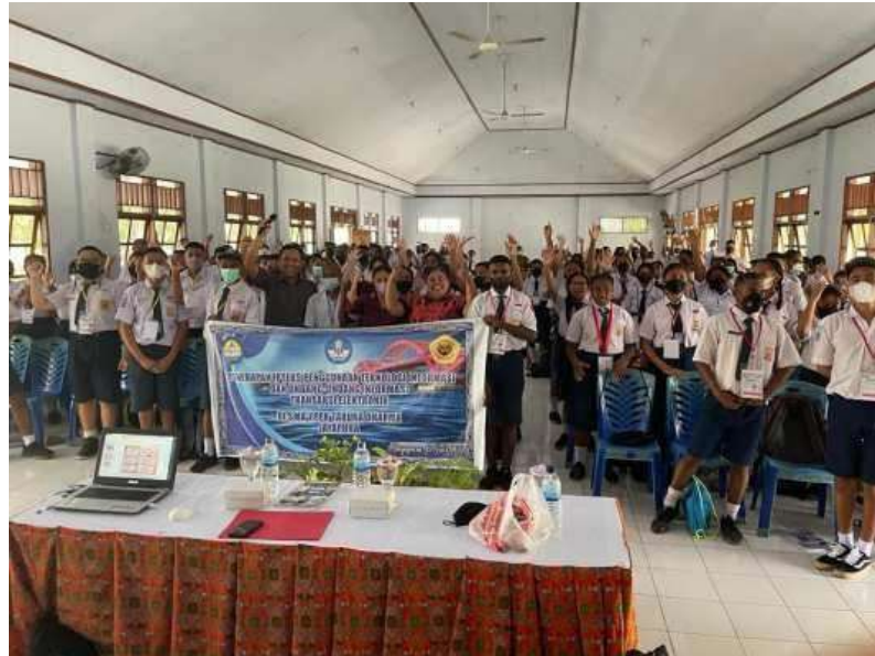
Gambar 3. Antusiasme Peserta dalam Kegiatan Sosialisasi

pertanyaan ini memberikan reaksi dan respons yang baik diantara siswa-siswi tentang pengetahuan mereka antara etika dan media sosial.