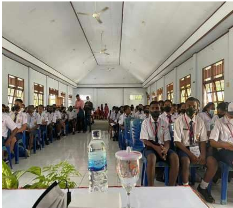
Gambar 2. Siswa-Siswi Mengikuti Pemaparan Materi dengan Antusias