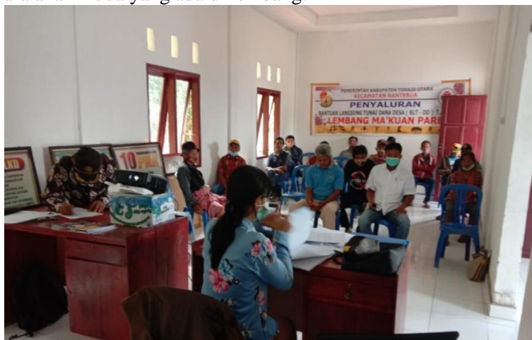
Gambar 1. Pemaparan Materi

Batu Rumbuk adalah nama badan usaha milik lembang di Lembang Ma'kuanpare Kecamatan Rantebua Kabupaten Toraja Utara yang berdiri sejak tahun 2017. Sejak mulai berdirinya BUMLem lebih kurang 6 tahun di Lembang ini modal awalnya adalah Rp50.000.000,00. Awalnya dana ini digunakan untuk membeli Sound System. Akan tetapi pada kenyataannya masih terdapat kendala dalam pengelolaan karena tidak adanya SDM yang dapat mengelola alat-alat tersebut. Usaha lain yang dikelola BUMLem Batu Rumbuk adalah usaha dekorasi. Dalam pengelolaan SDM yang diberdayakan adalah para anak muda yang ada di lembang.