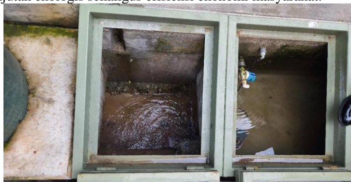
Gambar 3. Saluran Beton Sebagai Media Budidaya Ikan Lele

Di samping itu, inovasi pemanfaatan saluran air sebagai kolam budidaya ikan lele menunjukkan adanya kapasitas adaptif dan kreatif masyarakat dalam mengoptimalkan ruang lingkungan yang terbatas menjadi sumber daya produktif. Selain itu, masyarakat setempat juga turut berpartisipasi dalam pengumpulan sampah organik rumah tangga sebagai media budidaya maggot. Partisipasi masyarakat dalam pengumpulan sampah organik rumah tangga untuk dimanfaatkan sebagai media budidaya maggot menunjukkan adanya internalisasi nilai pengelolaan lingkungan berkelanjutan, di mana limbah domestik tidak lagi dipandang sebagai residu, melainkan sebagai sumber daya yang memiliki nilai ekologis dan ekonomis. Pemanfaatan maggot sebagai sumber pakan ikan lele yang dibudidayakan di saluran beton menunjukkan terbentuknya siklus pengelolaan limbah organik yang bersifat sirkular, di mana residu domestik diolah kembali menjadi sumber daya produktif yang mendukung keberlanjutan ekologis sekaligus efisiensi ekonomi masyarakat.