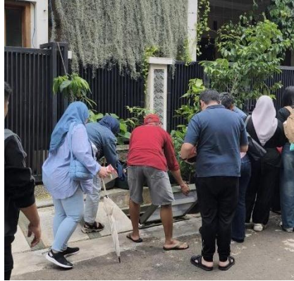
Gambar 2. Observasi Mahasiswa Universitas Pelita Harapan Pada Lingkungan RT 08 RW 04 Kelurahan Malaka Jaya, Kecamatan Duren Sawit, Jakarta Timur

Kegiatan kerja bakti lingkungan serta pengumpulan dan pemanfaatan sampah rumah tangga dalam wilayah tersebut, misalnya, tidak semata-mata berfungsi untuk menjaga kebersihan fisik wilayah, tetapi juga berperan dalam memperkuat kohesi sosial, meningkatkan rasa tanggung jawab bersama, serta menumbuhkan kesadaran kolektif terhadap pentingnya kualitas lingkungan permukiman. Partisipasi aktif warga dalam kegiatan tersebut memperlihatkan adanya proses internalisasi nilai kepedulian lingkungan, solidaritas sosial, serta etika komunal yang menjadi fondasi pengelolaan lingkungan berbasis masyarakat. Dalam kerangka hukum lingkungan sebagai hukum nilai, praktik ini mencerminkan transformasi norma perlindungan lingkungan menjadi perilaku sosial yang dihayati secara sukarela oleh warga, bukan semata-mata karena dorongan sanksi hukum formal.