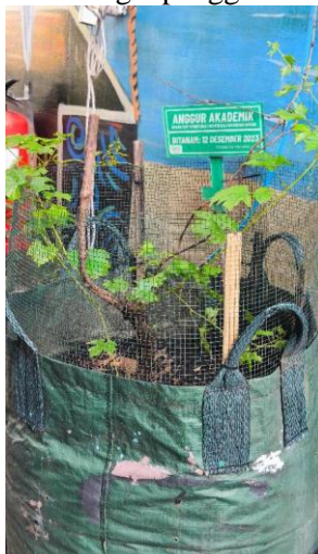
Gambar 5. Budidaya Anggur Akademik di Lingkungan T RT 08 RW 04 Kelurahan Malaka Jaya, Kecamatan Duren Sawit, Jakarta Timur

Lebih jauh, keberhasilan berbagai inisiatif lingkungan tersebut menjadikan RT 08 RW 04 Malaka Jaya sebagai rujukan pembelajaran bagi wilayah lain di sekitarnya. Berbagai kunjungan studi, proses replikasi program, serta penguatan jejaring sosial antarwilayah menunjukkan bahwa praktik pengelolaan lingkungan berbasis partisipasi masyarakat di wilayah ini memiliki daya transformasi yang melampaui batas administratif RT itu sendiri. Secara sosiologis, fenomena ini memperlihatkan terbentuknya model community-based environmental governance yang bertumpu pada partisipasi, kepemimpinan lokal, dan solidaritas sosial sebagai penggerak utama perubahan lingkungan.