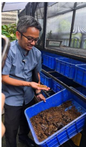
Gambar 4. Budidaya Maggot di Lingkungan T RT 08 RW 04 Kelurahan Malaka Jaya, Kecamatan Duren Sawit, Jakarta Timur

Lebih jauh, keberhasilan berbagai inisiatif lingkungan tersebut menjadikan RT 08 RW 04 Malaka Jaya sebagai rujukan pembelajaran bagi wilayah lain di sekitarnya. Berbagai kunjungan studi, proses replikasi program, serta penguatan jejaring sosial antarwilayah menunjukkan bahwa praktik pengelolaan lingkungan berbasis partisipasi masyarakat di wilayah ini memiliki daya transformasi yang melampaui batas administratif RT itu sendiri. Secara sosiologis, fenomena ini memperlihatkan terbentuknya model community-based environmental governance yang bertumpu pada partisipasi, kepemimpinan lokal, dan solidaritas sosial sebagai penggerak utama perubahan lingkungan.