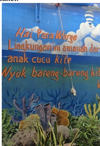
Gambar 1. Visi Penerapan Hukum Lingkungan Dalam RT 08

Berdasarkan hasil observasi yang dilakukan di RT 08 RW 04 Kelurahan Malaka Jaya, Kecamatan Duren Sawit, Jakarta Timur, terlihat adanya tingkat partisipasi masyarakat yang tinggi dalam pelaksanaan berbagai program pengelolaan lingkungan yang dirumuskan melalui mekanisme musyawarah warga di tingkat rukun tetangga. Program-program tersebut mencakup pengelolaan limbah rumah tangga, kegiatan kerja bakti lingkungan secara berkala, pemanfaatan saluran beton sebagai media budidaya ikan lele, serta pengembangan kegiatan usaha mikro, kecil, dan menengah (UMKM) yang bersumber dari hasil budidaya tersebut. Selain itu, lingkungan ini juga turut serta dalam inisiasi penghijauan serta penyediaan fasilitas umum untuk pengembangan masyarakat, yang dilakukan untuk pencegahan krisis planet.