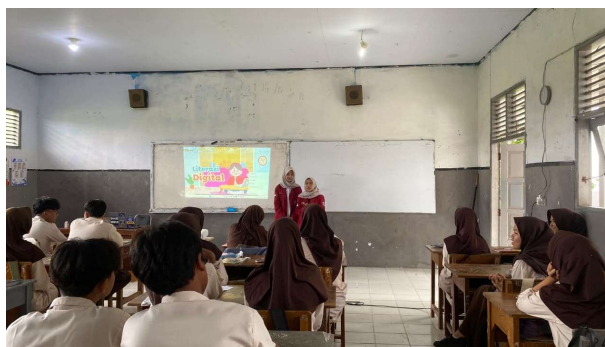
Gambar 5. Antusias Peserta Sosialisasi

Peserta sosialisasi dari SMAN I Bojonegara yang ikut serta sebanyak 30 siswa dan mereka sangat antusias untuk mendengarkan, berdiskusi terkait penggunaan digital bahkan pada saat pembahasan berita hoaks mereka sangat tertarik dan antusias dan mampu menceritakan pengalaman pribadinya yang terlalu mempercayai berita hoaks.