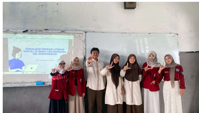
Gambar 1. Dokumentasi Kegiatan Sosialisasi

Adapun kegiatan PKM yang dilakukan oleh Tim kami dapat dilihat pada dokumentasi dibawah ini: