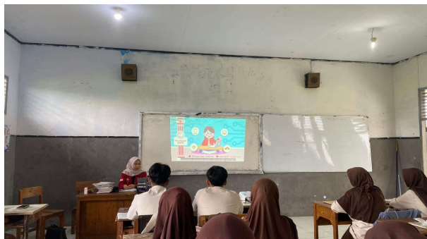
Gambar 4. Kegiatan Sosialisasi

Selama proses sosialisasi, peserta menunjukkan antusiasme tinggi, terutama saat sesi diskusi dan simulasi pengecekan fakta. Remaja cenderung lebih tertarik saat materi disampaikan melalui pendekatan visual dan kontekstual seperti video hoaks viral. Metode pembelajaran partisipatif terbukti mampu meningkatkan keterlibatan dan pemahaman secara menyeluruh. Dapat dilihat pada gambar 1 dibawah ini: