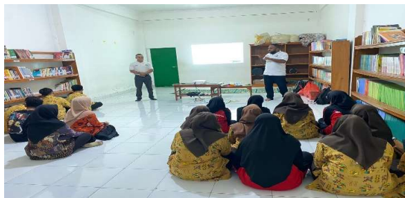
Gambar 3 Arahan tentang kegiatan PkM