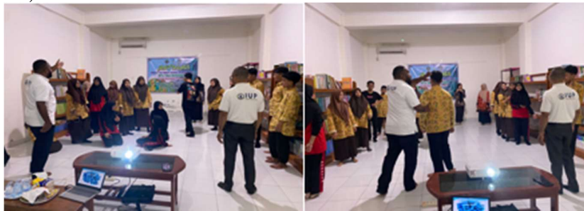
Gambar 5. Aktivitas Chinese Whisper

Setelah sesi pengantar, para peserta dibagi ke dalam dua kelompok untuk mengikuti aktivitas pembelajaran yang dikenal dengan istilah Chinese Whisper atau pesan berantai (lihat gambar 5). Pemateri terlebih dahulu memaparkan aturan permainan kepada seluruh peserta. Selanjutnya, peserta diinstruksikan untuk berdiri membentuk barisan sesuai dengan kelompok masing-masing dan mereka harus berdiri menghadap ke depan. Pemateri kemudian membisikkan sebuah kata atau frasa dalam bahasa Inggris sambil memperlihatkan flashcard yang memuat kata atau kalimat tersebut kepada peserta yang berada di barisan paling belakang dari kedua kelompok, contohnya kata “ student ” atau “ I am a student ”. Pesan tersebut disampaikan secara berantai dengan cara berbisik dari satu peserta ke peserta lainnya hingga mencapai peserta yang berdiri paling depan. Peserta yang menerima pesan lalu mengangkat tangan sebagai tanda telah menerima pesan, lalu mengucapkan kata atau kalimat yang didengar. Kelompok yang dapat menyampaikan pesan dengan benar dan jelas memperoleh tiga poin. Pada tahap selanjutnya, instruksi permainan dimodifikasi; peserta yang berada di posisi paling depan diminta untuk menuliskan kata atau kalimat yang diterima (berkaitan dengan kosakata profesi) di papan tulis ( whiteboard ).