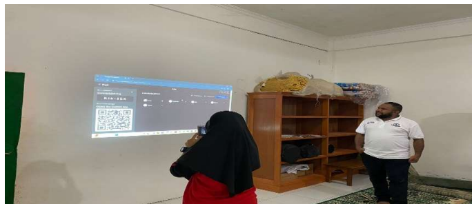
Gambar 1. Siswa memindai barcode untuk mengakses Quizlet

Selain itu, para siswa di MA Yaa Bunayya tergolong dalam generasi Z ( Generation Z ) yang usianya berada di 13 – 15 tahun dan pembelajaran dengan memanfaatkan smartphone cenderung meningkatkan motivasi ( motivation ) dan keterlibatan ( engagement ) dalam proses pembelajaran. Oleh sebab itu, penggunaan Quizlet, sebagai salah satu platform pembelajaran, sangatlah penting dalam upaya memperkenalkan serta mempromosikan eksposur bahasa ( language exposure ) kepada guru dan para siswa. Penggunaan platform pembelajaran online (Quizlet), yang diakses melalui smartphone , menjadi prioritas dalam kegiatan ini. Dalam penerapannya, Quizlet dapat diakses via akun Quizlet (dan setelah itu peserta dapat bergabung dengan cara memindai barcode atau memasukkan kode (lihat Gambar 1). Setelah itu siswa dapat bermain secara individu atau dalam kelompok (diatur dalam pengaturan oleh guru). Selanjutnya, mereka akan menjawab pertanyaan yang tampil di layar smartphone sambil guru dapat memantau permainan lewat layar laptop/ smartphone .