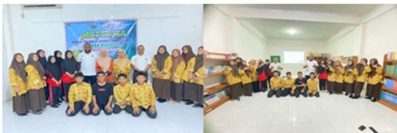
Gambar 8. Tim PkM PBI berfoto bersama guru dan siswa MA Yaa Bunayya

Dari hasil observasi, tim dosen juga mendeteksi adanya masalah yang menjadi tantangan selama kegiatan. Pertama, tidak semua peserta dapat memahami makna dari kosakata yang ditampilkan di aplikasi Quizlet, contohnya seperti kata benda umum ( common noun ) terkait profesi seperti vet , cook , dan steward . Selanjutnya, pemaparan terkait penggunaan aplikasi Quizlet perlu diberikan waktu lebih karena pada saat kegiatan berlangsung beberapa peserta dan guru belum dapat bergabung ke dalam Quizlet sehingga penggunaan waktu cenderung kurang efektif. Ketiga, sebelum kegiatan dilaksanakan, para peserta diberikan tes penempatan ( placement test ) untuk mengetahui level kemampuan berbahasa Inggrisnya agar dapat disesuaikan dengan materi. Tantangan-tantangan ini tentunya menjadi masukan yang sangat bermanfaat bagi tim dosen agar kedepannya.