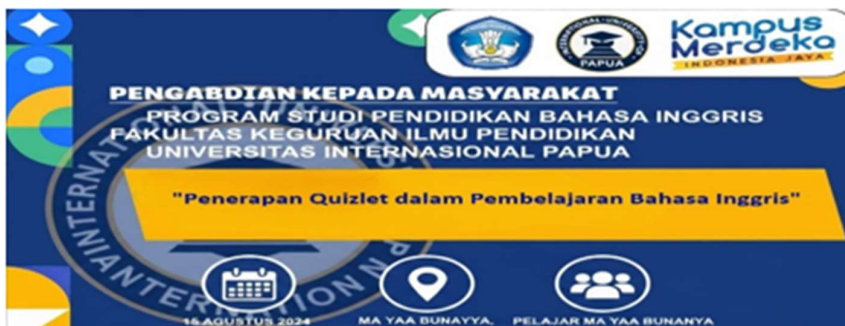
Gambar 2. Spanduk Kegiatan Pengabdian kepada Masyarakat