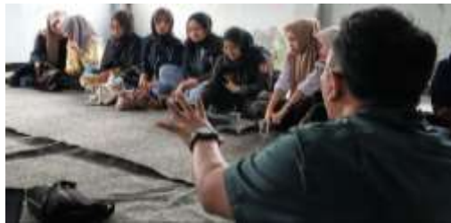
Gambar 1. Penyampaian Materi Sosialisasi

Upaya peningkatan pemahaman terkait pedoman pemberitaan ramah anak terhadap para jurnalis dan influencer sebagai penyebar informasi kepada khalayak luas perlu dilakukan secara berkelanjutan, mengingat bahwa kondisi kurang ramahnya media terhadap anak bukan karena tidak ada regulasi melainkan kurangnya pemahaman wartawan hingga dapur redaksi maupun influencer terkait Pedoman Pemberitaan Ramah Anak (PPRA). Membangun pemahaman dan kesadaran ini dilakukan melalui diskusi terkait Pemberitaan Ramah Anak dalam rangka mewujudkan Garut Layak Anak yang menjadi bagian dari program pemerintah.