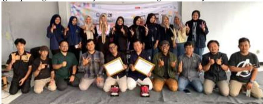
Gambar 4 Foto Bersama setelah proses Konsultasi dan Tanya Jawab

Berdasarkan hasil pengamatan, peserta literasi bisa membedakan mana konten atau berita yang dianggap tidak ramah anak dengan berita ramah anak. Mereka semakin menyadari pentingnya implementasi dalam pemberitaan ramah anak di Kabupaten Garut mengingat Pers maupun Influencer merupakan bagian penting dalam mewujudkan Garut sebagai daerah layak anak.