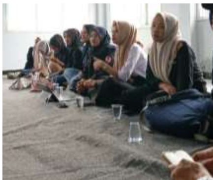
Gambar 3 Demonstrasi Produksi Berbasis Pedoman Pemberitaan Ramah Anak

Dalam kesempatan ini wartawan dan influencer juga didorong untuk menciptakan budaya kerja ramah anak, bahkan mendorong untuk menularkan budaya kerja media ramah anak sampai dengan tim redaksi.