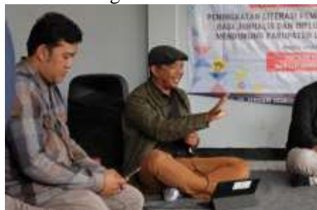
Gambar 2 Pendampingan Langsung

Peningkatan kapasitas jurnalis maupun influencer sebagai bagian pihak yang ikut memperjuangkan hak-hak anak melalui pemberitaan ramah anak bisa menjadi triger bagi sejumlah media grup yang sejauh ini melakukan homogenisasi informasi.