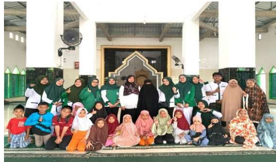
Gambar 1. Kegiatan Penyuluhan

perkenalan, kemudian dilanjutkan dengan perbincangan mulai dari apa itu diabetes dan hipertensi, cara mengatasinya, teknik menghilangkan stres, senam kaki, hingga jalan cepat bagi masyarakat yang menghadapi penyakit tersebut. Para lansia sangat antusias dengan informasi yang diberikan, karena bisa dibalang begitu. mendengarkan, mengajukan banyak pertanyaan tentang bagian-bagian yang belum mereka pahami. Semua orang yang terlibat sangat menyukainya, dan semua orang sangat antusias, jadi keseluruhan acara berjalan lancar tanpa hambatan