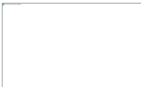
Gambar 1. Hasil Uji Heteroskedastisitas dengan Scatterplot

Berdasarkan tabel diatas diperoleh hasil variabel Komitmen Organisasi memperoleh nilai VIF sebesar 1,863 yang dimana nilai variabel tersebut lebih kecil dari 10 dan dapat disimpulkan tidak terdapat gejala multikoleniaritas. Variabel Budaya Kerja memperoleh nilai VIF sebesar 1,863 yang dimana nilai variabel tersebut lebih kecil dari 10 dan dapat disimpulkan tidak terdapat gejala multikoleniaritas.