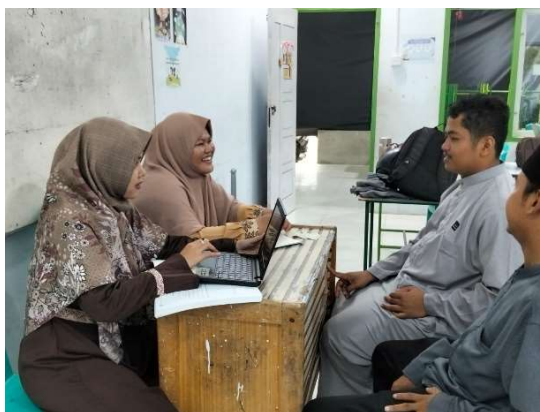
Gambar 1. Wawancara dengan Kepsek dan Wali Murid

Dengan demikian, dapat disimpulkan bahwa sinergi antara sekolah dan keluarga memiliki peran yang sangat penting dalam meningkatkan kualitas pendidikan. Meskipun telah berjalan dengan baik, diperlukan upaya berkelanjutan untuk mengatasi hambatan yang ada, seperti dengan meningkatkan fleksibilitas komunikasi, memberikan edukasi kepada orang tua tentang pentingnya pendampingan belajar, serta memperkuat program kolaboratif antara sekolah dan keluarga. Upaya ini diharapkan dapat menciptakan hubungan yang lebih harmonis dan efektif dalam mendukung keberhasilan pendidikan siswa secara optimal.