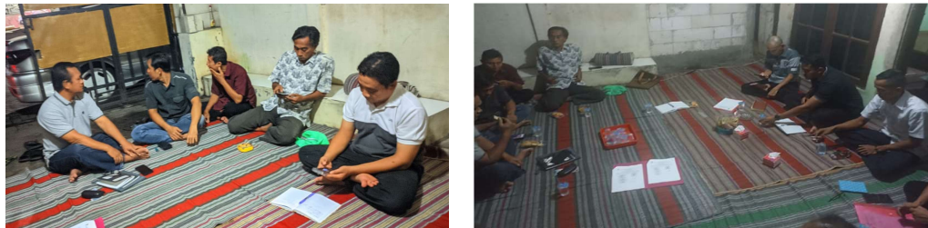
Gambar 1. Observasi Lapangan

Oleh karena itu, diperlukan sebuah Model Pemberdayaan Berbasis Komunitas untuk Karang Taruna: Pelatihan Make Up Artistik dan Memasak menuju peningkatan ekonomi di Kelurahan Krobokan mampu meningkatkan kemandirian ekonomi, memperkuat peran sosial di masyarakat, serta mencapai keberlanjutan dalam pendapatan keluarga.