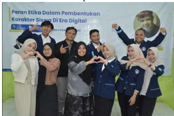
Dokumentasi 7. Dokumentasi Tim Abdimas

Berdasarkan tabel 1. deskripsi peserta menunjukkan bahwa mayoritas peserta kegiatan seminar pelatihan ini berjenis kelamin perempuan dengan jumlah sebanyak 36 atau di persenkan sebanyak 80% sedangkan peserta berjenis kelamin laki-laki berjumlah 9 atau di persenkan sebanyak 20% lalu peserta terbanyak terdapat di kelas 10 dengan 19 peserta atau di persenkan 53% selebihnya siswa dari kelas 11 sebanyak 17 orang atau di persenkan 47% Seluruh peserta berasal dari SMAN 3 Cikarang Utara