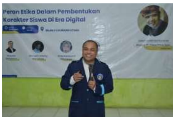
Dokumentasi 8. Penyampaian Materi Narasumber Mahasiswa