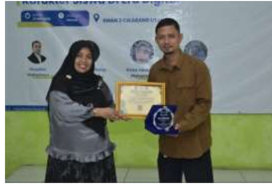
Dokumentasi 9. Penyerahan Plakat Dan Piagam Kepada Pihak Sekolah Dan Narasumber