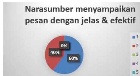
Dokumentasi 12. Hasil feedback narasumber

Umpan balik yang dikumpulkan melalui lembar angket dari peserta merupakan instrumen penting untuk menilai keberhasilan pelaksanaan seminar pelatihan yang diadakan di SMA 3 Cikarang Utara. Hasil kuisioner diolah menggunakan Ms. Excel dan disajikan dalam bentuk diagram. Umpan balik ini tidak hanya berguna sebagai sarana evaluasi kegiatan, tetapi juga memberikan saran konstruktif dari peserta untuk pengembangan kegiatan yang berkelanjutan. Petunjuk pengisian untuk survei umpan balik adalah sebagai berikut: 5 = Sangat Setuju Sekali, 4 = Sangat Setuju, 3 = Setuju, 2 = Tidak Setuju, dan 1 = Sangat Tidak Setuju.