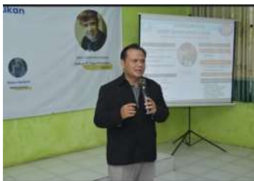
Dokumentasi 7. Penyampaian Materi Narasumber Praktisi

Di akhir kegiatan sebagai bentuk apresiasi tim abdimas terhadap peserta yang telah semangat hadir mengikuti kegiatan seminar pelatihan ini, peserta mendapatkan benefit Sertifikat