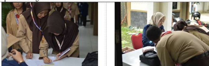
Dokumentasi . Registrasi Peserta

Acara dimulai setelah sesi registrasi. moderator memperkenalkan diri dan memberikan gambaran singkat tentang Peran Etika dalam Pembentukan Karakter siswa di era Digital . Kemudian menyanyikan lagu kebangsaan Indonesia Raya dan acara pembukaan ditutup dengan penyampaian sambutan-sambutan mulai dari ketua pelaksana, pihak sekolah, hingga dosen pembimbing.