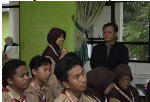
Dokumentasi 4. Sesi Diskusi dan Tanya Jawab

Wawasan yang lebih Sesi diskusi interaktif antara peserta dengan narasumber untuk memberikan mendalam Tentang Peran Etika dalam pembentukan Karakter di era digital