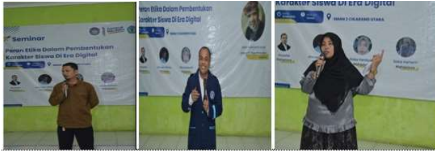
Dokumentasi 3. Sambutan - Sambutan