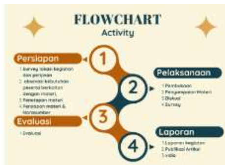
Dokumentasi 5. Kerangka kegiatan

Secara umum, struktur kegiatan dalam seminar ini dapat dijelaskan sebagai berikut:berikut