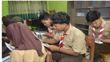
Dokumentasi 11. Pengisian Pre-Test dan Post-Test

hal tersebut. Sementara itu, pada indikator pertanyaan nomor 4, ditemukan bahwa 93% Peserta awalnya belum memahami pentingnya menghormati masing masing individu dengan berbagai beragam profil serta mengoptimalkan keragaman sebagai keunggulan untuk mencapai tujuan bersama, yang mencerminkan sikap harmonis. Setelah kegiatan, 100% peserta menyatakan telah memahami konsep tersebut. Oleh karna itu bisa di sarikan bahwa terjadi pendalaman pengetahuan di kalangan peserta seminar pelatihan ini, dan tujuan pelaksanaan kegiatan telah tercapai dengan sangat baik.