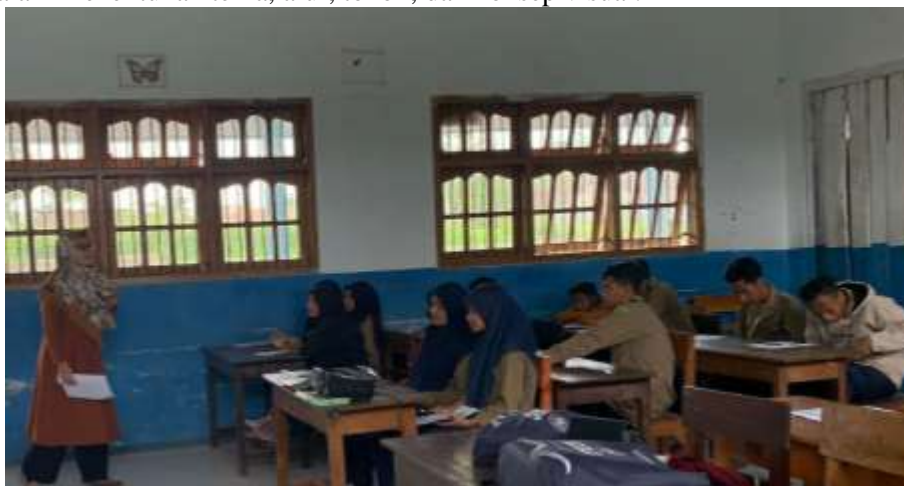
Gambar 2. Penyampaian materi oleh tim PKMS

Kegiatan pengabdian ini dilaksanakan dengan diawali dengan analisis kebutuhan. Kegiatan analisis kebutuhan diawali dengan (a) observasi, (b) wawancara, dan (c) diskusi dengan guru serta pihak sekolah untuk mengetahui kondisi literasi siswa, kompetensi guru dalam penulisan, serta ketersediaan bahan bacaan. Kegiatan ini dilaksanakan pada tanggal 31 Oktober 2025. Setelah diumumkan hasil seleksi PKMS yang lolos dari Universitas, tim mulai menyusun materi dan modul pelatihan. Tim menyusun materi yang memuat (a) konsep literasi baca-tulis, (b) literasi visual, (c) teknik menulis cerita anak, (d) penyusunan karakter, alur, pesan moral, dan (e) serta dasar-dasar ilustrasi dan storyboard. Tahapan selanjutnya, tim melaksanakan pelatihan Penyusunan Cerita Anak Bergambar pada tanggal 13 Februari 2026. Kegiatan pelatihan ini dilakukan dalam beberapa sesi: (a) pelatihan menulis cerita anak, (b) pengembangan storyboard dan ilustrasi, (c) penyusunan draf cerita lengkap. Dalam kegiatan ini peserta dibimbing dalam menentukan tema, alur, tokoh, dan konsep visual.