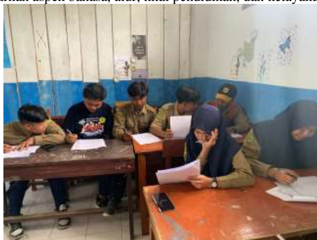
Gambar 3. Peserta melakukan kurasi naskah

Penyampaian materi oleh tim PKMS Kemudian di tanggal 14 Februari 2026 tim melaksanakan kegiatan Kurasi Naskah dan Ilustrasi. Pada tahapan ini tim melakukan kurasi terhadap naskah dan ilustrasi peserta berdasarkan aspek bahasa, alur, nilai pendidikan, dan kelayakan visual.