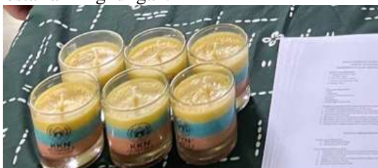
Gambar 3. Hasil produk lilin berbahan dasar minyak jelantah

Secara keseluruhan, kegiatan ini dapat dijadikan model pengabdian masyarakat berbasis ekonomi sirkular, di mana limbah diolah menjadi produk bernilai, sekaligus meningkatkan kesejahteraan masyarakat dan menjaga kelestarian lingkungan.