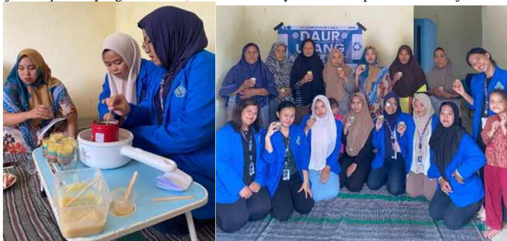
Gambar 1 dan 2. Proses pelatihan pembuatan lilin aromaterapi