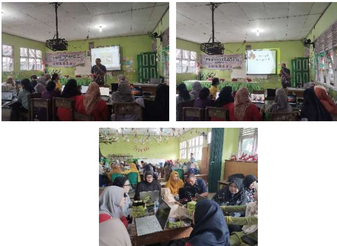
Gambar 2. Dokumentasi kegiatan presentasi