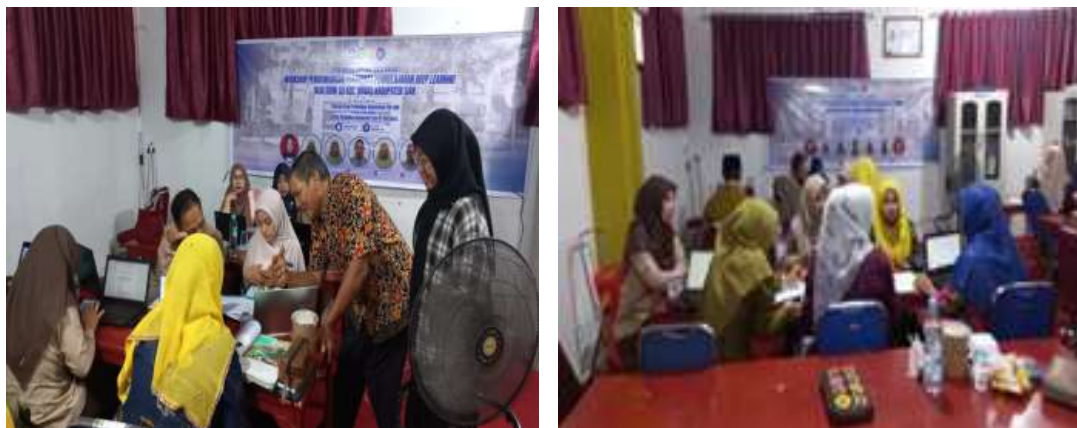
Gambar 3. Dokumentasi Kegiatan Praktek