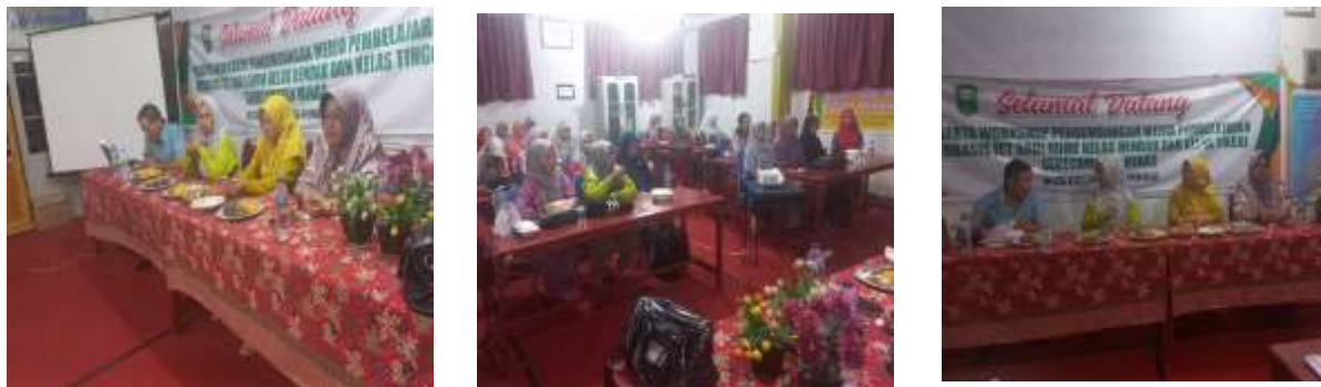
Gambar 5. Dokumentasi Kegiatan Penutupan

sekolah masing-masing. Dengan penguatan ini diharapkan peserta yang ikut dalam kegiatan ini dapat mengimbaskannya kepada teman sejawat.