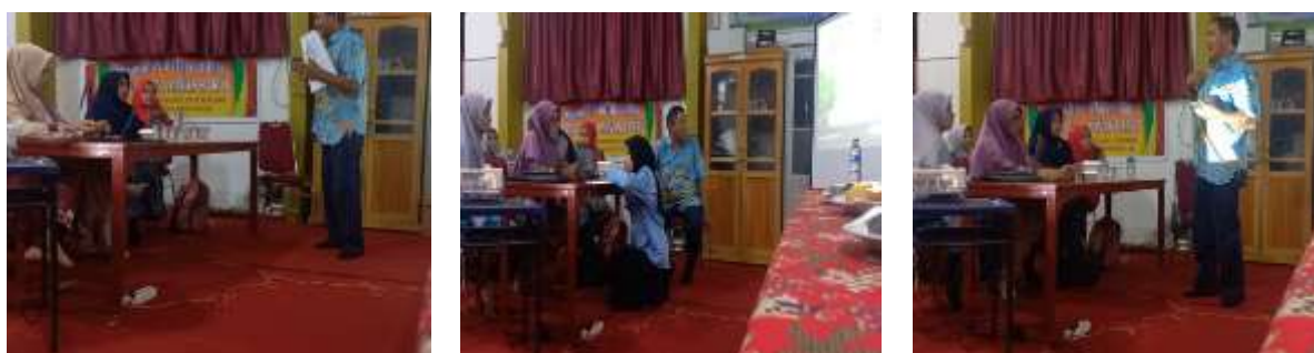
Gambar 4. Dokumentasi Kegiatan Simulasi

Setelah diskusi terkait dengan contoh simulasi, selanjutnya kepada semua kelompok diminta melakukan simulasi produk yang dihasilkannya. Gambar 4 menunjukkan kegiatan simulasi peserta terdapat beberapa hal yang menjadi catatan, yakni: (1) beberapa konteks masalah yang disajikan melalui media sebagai wahana memotivasi siswa berbeda dengan yang dimuat dalam LKPD sehingga pemahaman siswa terhadap masalah yang dibahas tidak optimal; (2) aktivitas menerapkan sebagai latihan atau proyek karena harus melakukan observasi ke lingkungan siswa tidak terlaksana mengingat waktu yang terbatas. Saran terkait ini dengan hal ini, adalah aktivitas tersebut dapat digantikan dengan video pembelajaran.