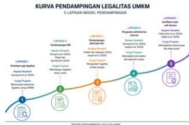
Gambar 2. Model Pendampingan Legalitas Berjenjang Berbasis Gap Kebutuhan UMKM Kegiatan pengabdian ini menunjukkan bahwa UMKM di Kabupaten Sumenep masih menghadapi gap legalitas yang besar. Dari 211 UMKM yang terdata, 56 UMKM atau 26,5% memiliki NIB, 16

Model ini berbeda dari Rumawi et al. (2024) dan Afyiah dan Qurratu'aini (2025), yang berfokus pada pendampingan NIB melalui OSS. Model ini juga berbeda dari Fadilah dan Setiawan (2023) serta Inayah et al. (2023), yang menekankan PIRT dan halal pada produk tertentu. Selain itu, model ini memperluas temuan Fathurohim et al. (2024) dan Nasik et al. (2025), yang berfokus pada self declare, dengan menempatkan sertifikasi halal sebagai tahap akhir dari kesiapan legalitas dan administrasi UMKM. Dengan demikian, artikel ini memberi kontribusi praktis berupa model pendampingan yang lebih sistematis, terukur, dan dapat direplikasi pada UMKM daerah lain.