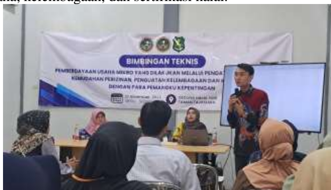
Gambar 1. Dokumentasi Bimbingan Teknis Pemberdayaan Usaha Mikro di Gedung Halal Hub Taman Tajamara

Selain data kuantitatif, kegiatan juga didukung dokumentasi lapangan yang menunjukkan proses bimbingan teknis, sosialisasi, dan diskusi bersama pelaku UMKM. Dokumentasi ini menunjukkan bahwa program dilaksanakan secara partisipatif dan melibatkan pelaku usaha secara langsung dalam penguatan legalitas usaha, kelembagaan, dan sertifikasi halal.