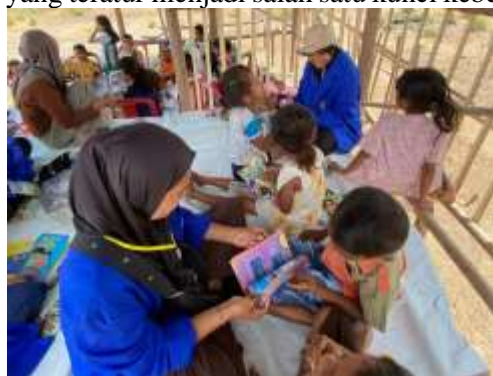
Gambar 5. Mendampingi Anak-Anak Membaca

Kegiatan pondok baca di Desa Neotonda dilaksanakan secara rutin setiap sore hari, kecuali Minggu, dengan tujuan membentuk kebiasaan literasi anak-anak. Rutinitas ini sangat penting karena konsistensi waktu belajar dapat menumbuhkan kedisiplinan dan membiasakan anak untuk meluangkan waktu khusus dalam membaca. Kebiasaan yang dilakukan secara berulang dalam lingkungan yang mendukung akan membentuk pola perilaku positif yang melekat dalam diri anak (Amalia & Harfiani, 2024). Oleh karena itu, jadwal yang teratur menjadi salah satu kunci keberhasilan kegiatan pondok baca.