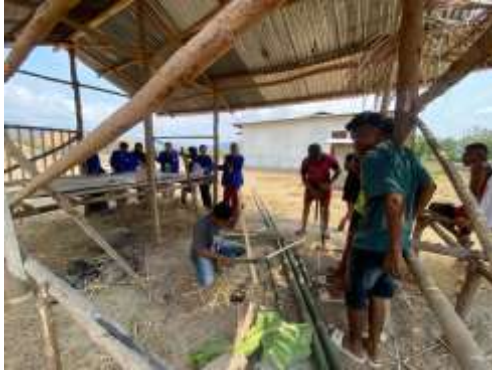
Gambar 1. Pembuatan Pondok Baca