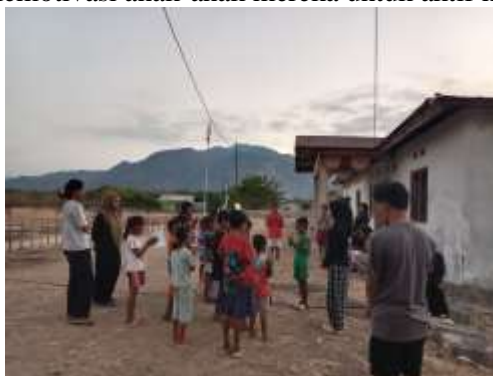
Gambar 4. Pengumpulan Peserta Usia 6-12 Tahun

bagi anak-anak di desa. Kepala Desa turut memberikan dukungan dan dorongan kepada para orang tua agar mengizinkan sekaligus memotivasi anak-anak mereka untuk aktif mengikuti kegiatan literasi.