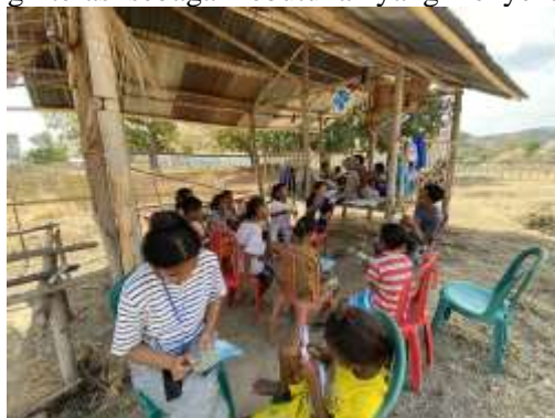
Gambar 5. Anak-Anak Menuliskan Cerita Sederhana

Pondok baca di Desa Neotonda tidak hanya berfungsi sebagai sarana meningkatkan kemampuan membaca, tetapi juga sebagai media pembentukan budaya literasi yang berkelanjutan. Anak-anak didorong untuk menjadikan membaca sebagai bagian dari aktivitas sehari-hari, baik di pondok baca, di sekolah, maupun di rumah. Fasilitator berperan memberikan arahan, bimbingan, serta contoh positif agar anak-anak terbiasa memandang literasi sebagai kebutuhan yang menyenangkan.