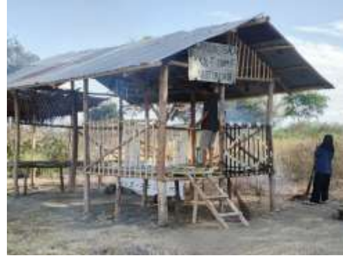
Gambar 2. Pondok Baca

Gambar di atas memperlihatkan sebuah pondok sederhana yang dibangun sebagai sarana Pondok Baca KKN-T Unimof di Desa Neotonda. Pondok ini menjadi bukti nyata dari tahap persiapan yang matang dan sistematis yang dilakukan oleh tim pengabdian masyarakat. Meskipun berbentuk sederhana dengan material seadanya, keberadaan pondok ini mencerminkan upaya menciptakan ruang belajar yang nyaman dan kondusif bagi anak-anak.