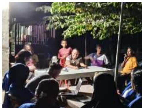
Gambar 3. Sosialisasi Bersama Kepala Desa serta Marsyarakat

Tahap sosialisasi menjadi langkah penting setelah persiapan karena menentukan sejauh mana masyarakat memahami dan menerima program pondok baca. Sosialisasi dilakukan dengan melibatkan orang tua dan tokoh masyarakat agar mereka mengetahui manfaat kegiatan terhadap perkembangan anak. Keberhasilan suatu program sangat dipengaruhi oleh tingkat penerimaan dan partisipasi masyarakat terhadap program yang dilaksanakan (Sari & Sadono, 2018). Oleh karena itu, komunikasi yang baik menjadi kunci agar orang tua tidak hanya memberikan izin, tetapi juga mendorong anak-anak mereka untuk berpartisipasi secara aktif. Setelah tahap sosialisasi, kegiatan dilanjutkan dengan pengumpulan peserta yang difokuskan pada anak-anak usia 6–12 tahun, baik yang masih bersekolah maupun tidak.