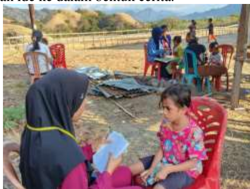
Gambar 6. Anak-Anak Menceritakan Kembali Isi Tulisan

Gambar di atas memperlihatkan suasana kegiatan anak-anak di Pondok Baca Desa Neotonda yang sedang menuliskan cerita sederhana berdasarkan pengalaman dan imajinasi mereka. Kegiatan ini merupakan bagian dari upaya penguatan budaya literasi, di mana anak-anak tidak hanya membaca, tetapi juga diajak mengekspresikan kembali gagasan dan perasaan mereka melalui tulisan (Utomo et al., 2024). Fasilitator mendampingi anak-anak dengan memberikan bimbingan serta motivasi agar mereka lebih percaya diri dalam menuangkan ide ke dalam bentuk cerita.