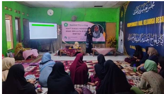
Gambar 1. Dokumentasi Proses Tanya Jawab Berlangsung

Berdasarkan hasil yang tersaji pada Tabel 1, kegiatan edukasi terpadu menunjukkan bahwa wali murid mengalami peningkatan pemahaman pada berbagai aspek, meliputi penguatan karakter dan pendidikan agama dalam keluarga, pemenuhan gizi seimbang, serta keselamatan lingkungan rumah. Selain itu, partisipasi aktif peserta dalam sesi diskusi dan tanya jawab memperlihatkan adanya keterlibatan yang tinggi dalam proses pembelajaran. Hasil evaluasi secara kualitatif juga menunjukkan bahwa peserta tidak hanya memahami materi yang disampaikan, tetapi juga memiliki kesiapan untuk mengimplementasikannya dalam kehidupan sehari-hari, sehingga kegiatan ini memberikan dampak positif terhadap peningkatan kesadaran dan peran orang tua dalam mendukung tumbuh kembang anak secara optimal.