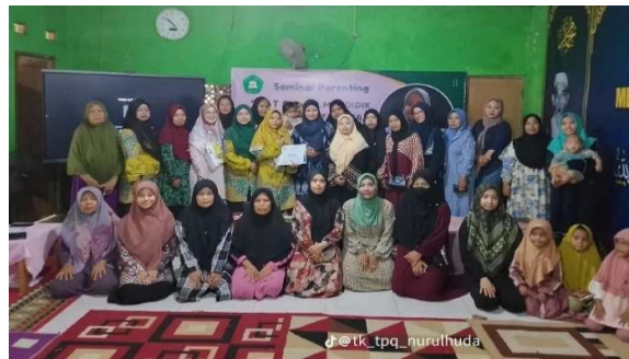
Gambar 1. Dokumentasi Bersama Peserta Kegiatan Pengabdian Masyarakat

Suasana kegiatan pengabdian kepada masyarakat di TK Nurul Huda berlangsung dengan kondusif, interaktif, dan penuh antusiasme dari para wali murid. Hal ini terlihat dari partisipasi aktif peserta dalam mengikuti penyampaian materi, keterlibatan dalam sesi diskusi, serta respon positif yang ditunjukkan selama kegiatan berlangsung. Interaksi antara pemateri dan peserta berjalan dua arah,