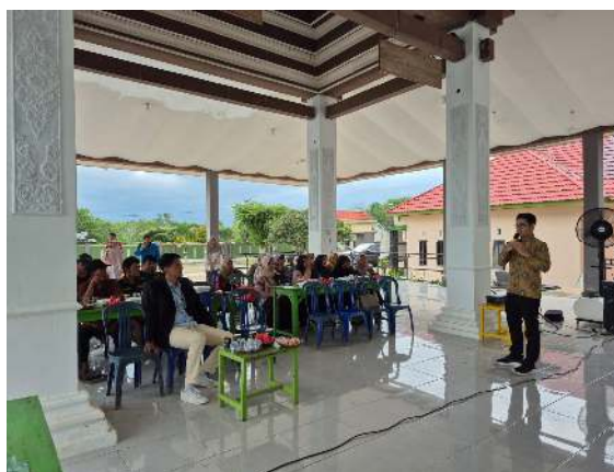
Gambar 1. Dokumentasi Kegiatan Edukasi Bahaya Pinjol Ilegal di Desa Sumpersari

Kegiatan ini juga memperlihatkan pentingnya kolaborasi antara perguruan tinggi, pemerintah desa, OJK, dan tokoh masyarakat. Perguruan tinggi dapat berperan sebagai penggerak edukasi, pemerintah desa membantu menjangkau peserta dan menyebarkan informasi, sedangkan otoritas terkait menyediakan data dan kanal verifikasi resmi. Kolaborasi ini penting karena modus pinjol ilegal terus berubah mengikuti perkembangan teknologi dan pola komunikasi digital masyarakat.