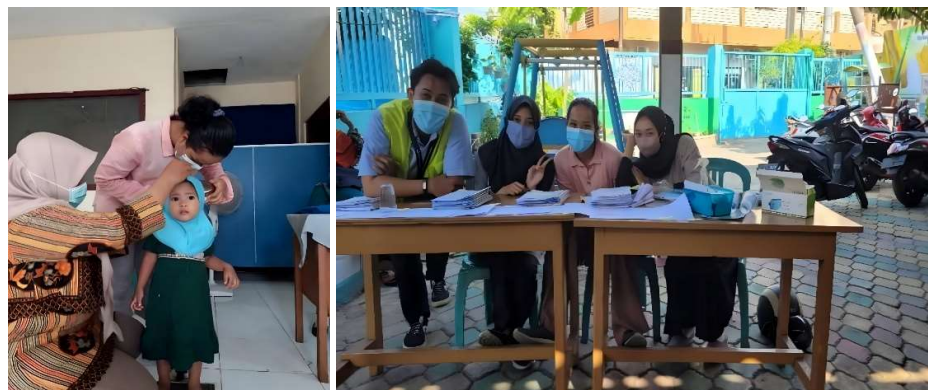
Gambar 2. Pelaksanaan Pemeriksaan Kesehatan Pada Anak Sponsor Gugah Nurani Indonesia CDP Surabaya

Jadwal utama kegiatan pemeriksaan kesehatan dilaksanakan pada tanggal 14-16 Oktober 2022 di Balai RW 06 dan Balai RW 14 bermula pukul 14.00 WIB sampai 16.00 WIB. Kemudian diadakan aktivitas pemeriksaan kesehatan susulan yaitu pada tanggal 21 Oktober, 28 Oktober, 30 November, 2 Desember 2022 di Puskesmas Wonokusumo. Adapun program tersebut diadakan sebanyak 7 sesi karena terdapat anak-anak sponsor yang tidak dapat mengikuti kegiatan pemeriksaan kesehatan di tanggal utama dengan alasan bentrok dengan jam sekolah, tidak memiliki kendaraan, karena hujan, tidak ada yang mengantar dan alasan lainnya. Rata rata jumlah anak sponsor yang mengikuti kegiatan pemeriksaan kesehatan adalah lebih dari 30 anak dalam satu hari. Jumlah seluruh anak sponsor yang mengikuti kegiatan pemeriksaan kesehatan adalah 153 anak dari 177 anak sponsor. Anak sponsor yang berusia 18 tahun adalah sebanyak 60 anak. Adapun anak-anak sponsor yang tidak mengikuti kegiatan pemeriksaan kesehatan mayoritas berusia 18 tahun dan memiliki berbagai macam alasan, beberapa alasannya yaitu sibuk magang, ada yang sudah bekerja, ada yang baru masuk ke jenjang perkuliahan sehingga memiliki banyak kegiatan. Berdasarkan hasil dari pemeriksaan kesehatan yang telah dilakukan, masalah gigi menjadi isu kesehatan sangat banyak didapati anak-anak sponsor. Adapun masalah gigi yang banyak terjadi adalah gigi berlubang dan karang gigi.