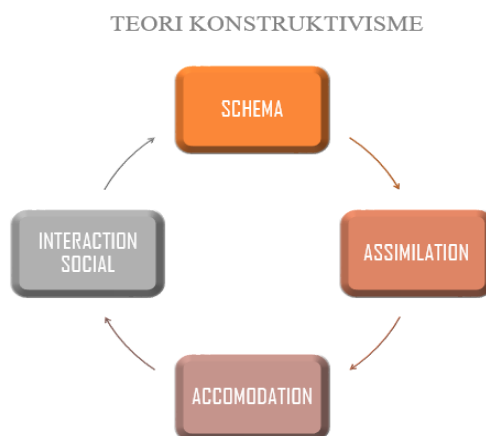
Gambar 1. Proses pemahaman kader milenial NU menggunakan Teori Konstruktivisme.