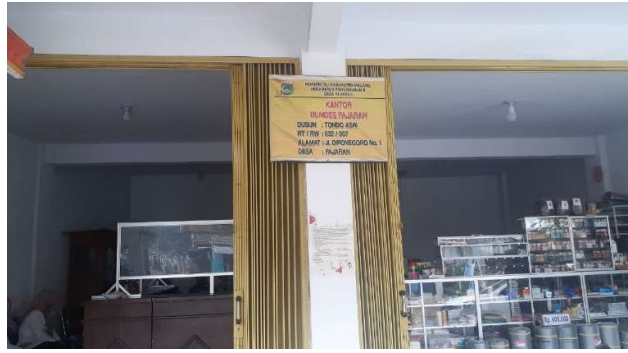
Gambar 3. Salah satu Unit Usaha ATK BUM Desa Ki Ageng