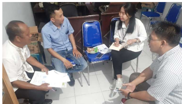
Gambar 2. FDG dengan Pengurus BUM Desa Ki Ageng Desa Pajajaran