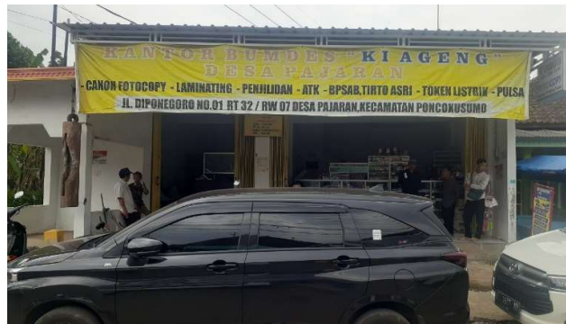
Gambar 1. Kantor BUM Desa Ki Ageng Desa Pajaran

Dari perspektif kelembagaan, BUM Desa Ki Ageng Pajaran telah memiliki visi dan misi yang komprehensif dan berorientasi pada pembangunan ekonomi berkelanjutan berbasis potensi lokal. Namun, implementasinya masih memerlukan penguatan dalam aspek tata kelola, sinergi antar unit usaha, serta peningkatan partisipasi masyarakat. Oleh karena itu, diperlukan langkah strategis berupa peningkatan kapasitas sumber daya manusia melalui pelatihan dan pendampingan, penguatan permodalan, pengembangan inovasi usaha, serta optimalisasi kemitraan dengan berbagai pihak. Dengan upaya tersebut, BUM Desa diharapkan mampu meningkatkan kontribusinya terhadap Pendapatan Asli Desa (PAD) serta mewujudkan kesejahteraan masyarakat secara berkelanjutan.