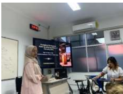
Gambar 1. Sesi pemaparan materi tata keprotokolan dan teknik dasar public speaking .

Selama sesi simulasi berlangsung, tim pengabdian secara aktif memberikan pendampingan dan umpan balik ( feedback ) konstruktif. Fokus pendampingan diberikan pada koreksi postur tubuh yang tegak dan profesional, cara memegang mikrofon yang tepat (jarak dan sudut), pengaturan napas dari diafragma untuk menghasilkan power suara yang stabil, serta teknik kontak mata ( eye contact ) untuk membangun interaksi dengan audiens. Dokumentasi pada Gambar 1 dan Gambar 2 menunjukkan suasana interaktif saat pemaparan materi dan antusiasme peserta saat mendemonstrasikan peran sebagai Master of Ceremony .