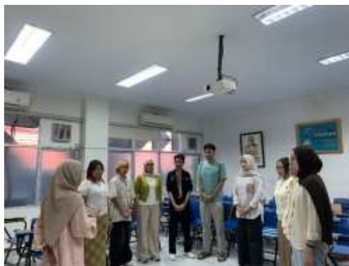
Gambar 2. Anggota Tim Protokoler saat melakukan simulasi praktik menjadi MC dengan pendampingan tim pengabdian.

Berdasarkan dokumentasi pada Gambar 1, terlihat tahap awal pelatihan di mana tim pengabdian memberikan pemaparan materi komprehensif secara interaktif. Pada fase kognitif ini, fokus utama adalah menyamakan persepsi peserta terkait fondasi teoretis public speaking , etika keprotokolan, dan penyusunan naskah ( scripting ) yang sesuai dengan standar akademik kampus. Pemahaman dasar ini menjadi modal penting sebelum peserta terjun ke sesi praktik.