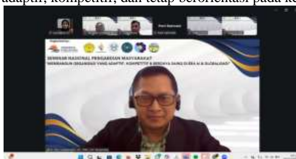
Gambar 1. Tangkapan layar narasumber

Secara umum, pelaksanaan kegiatan berjalan dengan lancar dan mendapatkan respons positif dari peserta. Tingginya antusiasme peserta terlihat dari partisipasi aktif selama kegiatan berlangsung, baik dalam sesi diskusi maupun dalam pengisian evaluasi kegiatan. Peserta menyampaikan bahwa materi yang diberikan sangat relevan dengan kondisi saat ini, terutama dalam menghadapi perubahan global dan perkembangan teknologi yang semakin kompleks. Kegiatan ini dinilai mampu meningkatkan pemahaman peserta mengenai pentingnya transformasi digital dan penguatan organisasi berbasis ekonomi Islam secara berkelanjutan. Selain itu, kegiatan ini juga memberikan wawasan baru bagi peserta mengenai pentingnya kolaborasi antara nilai-nilai syariah dan inovasi teknologi sebagai upaya menciptakan organisasi yang adaptif, kompetitif, dan tetap berorientasi pada kemaslahatan masyarakat.