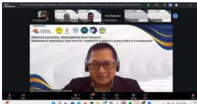
Gambar 1. Tangkapan layar narasumber PkM

menjadi sarana untuk meningkatkan kualitas pelayanan, memperluas jaringan organisasi, dan memperkuat komunikasi dengan masyarakat. Secara umum, pelaksanaan kegiatan pengabdian berjalan dengan baik dan memberikan dampak positif terhadap peningkatan pemahaman peserta mengenai pentingnya tata kelola organisasi Islami yang adaptif, profesional, dan responsif terhadap perkembangan teknologi serta tantangan persaingan global.