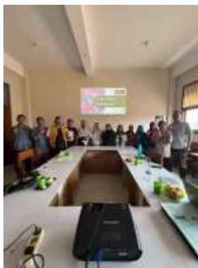
Gambar 1. Tata Letak Spasial Berkonsep Huruf "U" untuk Membangun Kedekatan Psikologis dan Kesetaraan Komunikasi.

Rekam jejak visual selama fase transfer pengetahuan menunjukkan desain intervensi yang sangat kondusif dan memecah kekakuan struktural. Dokumentasi memperlihatkan fasilitator dan peserta berada dalam tata letak duduk melingkar atau berkonsep huruf "U". Formasi spasial ini secara psikologis menghapus jarak antara narasumber dan peserta, memfasilitasi komunikasi dua arah yang lebih setara dan interaktif.