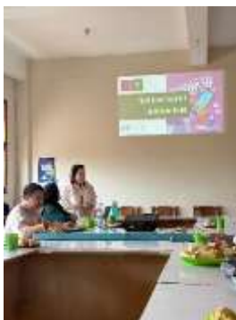
Gambar 2. Pemaparan Terstruktur Materi Information Behaviour Melalui Pendekatan Visualisasi Proyektor.

Dinamika pemberdayaan mencapai titik optimalnya ketika sesi pemaparan bertransisi menjadi diskusi dialogis. Dokumentasi kegiatan memotret secara spesifik momen-momen krusial di mana para peserta menunjukkan atensi penuh dan tidak sekadar menjadi pendengar pasif. Observasi partisipatif menangkap antusiasme yang tinggi, terlihat dari keaktifan peserta dalam memberikan respons, mengajukan pertanyaan, serta mengonfirmasi materi dengan pengalaman riil mereka di komunitas. Keterlibatan aktif dari berbagai representasi peserta yang terekam jelas dalam gestur proaktif saat berdiskusi membuktikan bahwa intervensi program berhasil menjembatani kesenjangan antara teori akademik dan realitas empiris di lapangan.