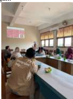
Gambar 3. Antusiasme dan Keterlibatan Aktif Peserta dalam Diskusi Dialogis Membedah Realitas Disrupsi Informasi.

Dinamika pemberdayaan mencapai titik optimalnya ketika sesi pemaparan bertransisi menjadi diskusi dialogis. Dokumentasi kegiatan memotret secara spesifik momen-momen krusial di mana para peserta menunjukkan atensi penuh dan tidak sekadar menjadi pendengar pasif. Observasi partisipatif menangkap antusiasme yang tinggi, terlihat dari keaktifan peserta dalam memberikan respons, mengajukan pertanyaan, serta mengonfirmasi materi dengan pengalaman riil mereka di komunitas. Keterlibatan aktif dari berbagai representasi peserta yang terekam jelas dalam gestur proaktif saat berdiskusi membuktikan bahwa intervensi program berhasil menjembatani kesenjangan antara teori akademik dan realitas empiris di lapangan.