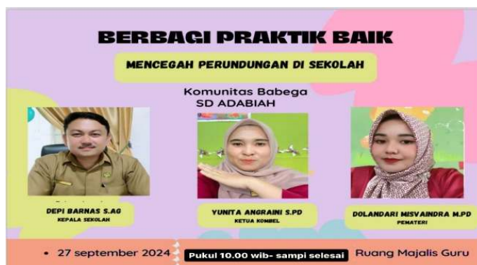
Gambar 1. Pelaksanaan Workshop di SD Adabiah Kota Padang

Pelaksanaan workshop tentu sangat banyak mamfaatnya, apalagi yang berhubungan nanti dengan penilaian baik aspek kognitif, aspek afektif dan aspek psikomotorik. Hal tersebut bisa dilihat dari: