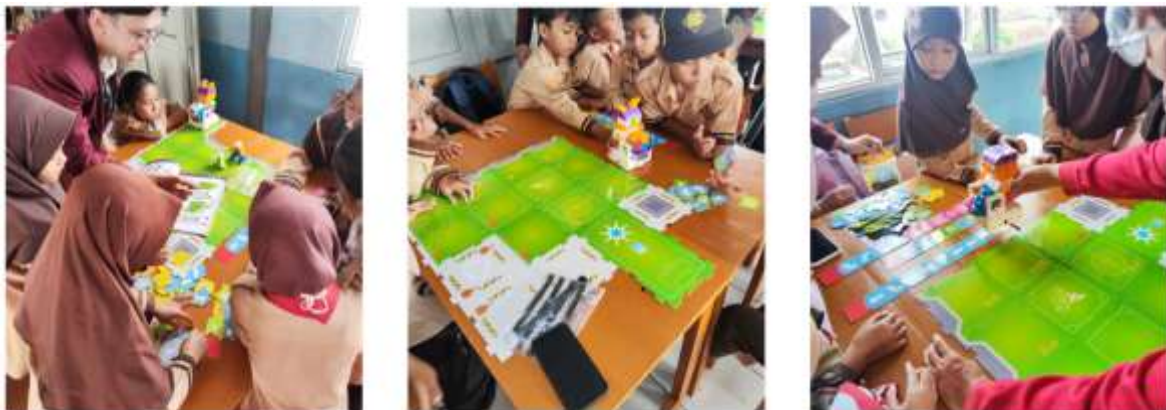
Gambar 4. Siswa sedang mencoba Robot Gigo First Coding. Siswa menyusun instruksi-instruksi untuk robot untuk bergerak sesuai dengan panduan.

Selanjutnya, kegiatan dilanjutkan dengan metode unplugged melalui permainan robot menggunakan Kids First Coding, di mana siswa diminta untuk menyusun urutan instruksi secara logis agar robot dapat menyelesaikan suatu tugas, dalam hal ini permainan bola. Aktivitas ini melatih siswa dalam memahami konsep urutan (sequencing), sebab-akibat, serta pengambilan keputusan secara sederhana (lihat Gambar 4).