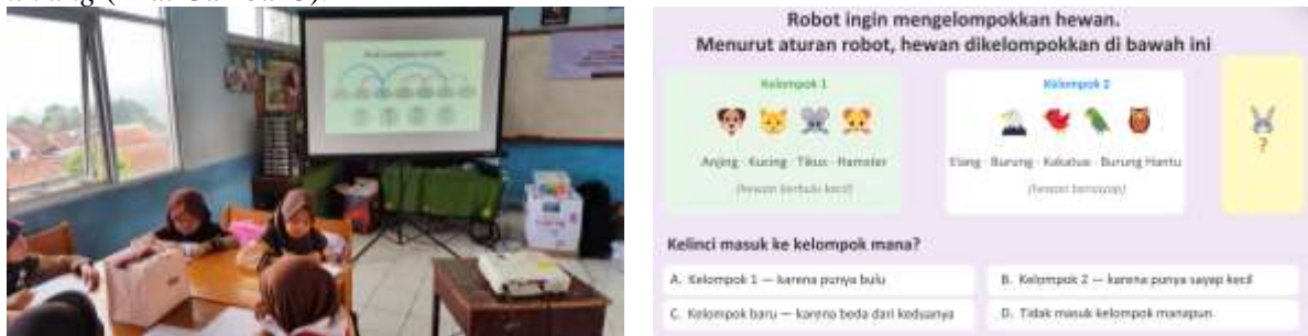
Gambar 3. Siswa mengerjakan pre-test dan post-test soal-soal computational thinking (CT).

Kegiatan pengabdian kepada masyarakat ini diawali dengan penyampaian materi mengenai computational thinking , khususnya pengenalan konsep berpikir logis melalui berbagai soal permainan sederhana yang disesuaikan dengan tingkat pemahaman siswa sekolah dasar. Materi ini bertujuan untuk membangun dasar kemampuan berpikir sistematis dan pemecahan masalah secara bertahap. Dimulai dengan kegiatan pre-test dan diakhir dengan post-test menggunakan soal-soal bertipe computational thinking (lihat Gambar 3).