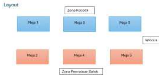
Gambar 2. Memunculkan Style dalam Template

Kegiatan pengabdian kepada masyarakat ini diawali dengan penyampaian materi mengenai computational thinking , khususnya pengenalan konsep berpikir logis melalui berbagai soal permainan sederhana yang disesuaikan dengan tingkat pemahaman siswa sekolah dasar. Materi ini bertujuan untuk membangun dasar kemampuan berpikir sistematis dan pemecahan masalah secara bertahap. Dimulai dengan kegiatan pre-test dan diakhir dengan post-test menggunakan soal-soal bertipe computational thinking (lihat Gambar 3).