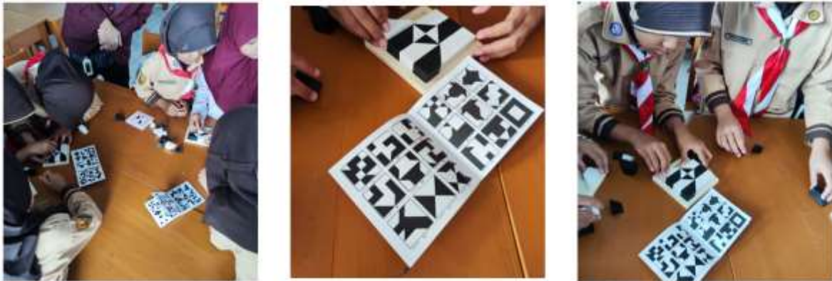
Gambar 5. Siswa sedang menyelesaikan problem logika dengan permainan hiding blocks. Tingkat kesulitan pada permainan ini adalah bagaimana cara menyembunyikan blok sehingga pola terbentuk seperti instruksi yang diberikan.

Secara keseluruhan, rangkaian kegiatan ini berlangsung secara interaktif dan menyenangkan, serta mampu meningkatkan keterlibatan siswa dalam proses pembelajaran. Pendekatan berbasis permainan terbukti efektif dalam menstimulasi kemampuan berpikir komputasi siswa sejak dini.