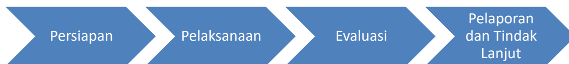
Gambar 1. Tahapan kegiatan pengabdian kepada masyarakat

Tahapan kegiatan pengabdian kepada masyarakat ini dilaksanakan secara bertahap sebagai berikut: