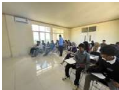
Gambar 2 Monitoring Penyusunan Materi