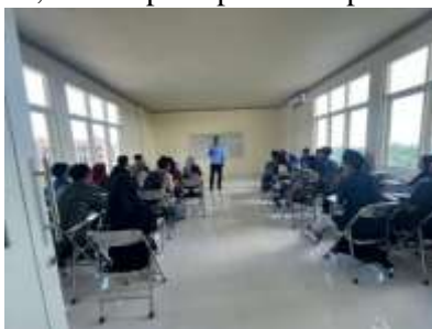
Gambar 1 Penyampaian Materi Awal