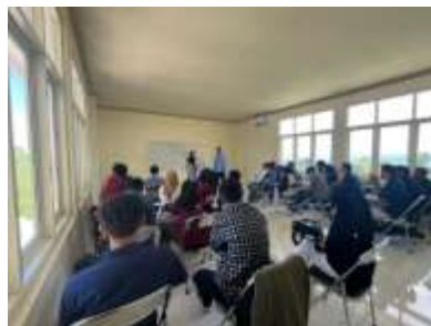
Gambar 3 Pendampingan Public Speaking Peserta