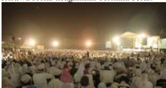
Gambar 2. Ribuan Jamaah Duduk Khidmat Mengikuti Acara Shalawatan pada Malam Hari di Lapangan Terbuka

Gambar 1 memperlihatkan kemeriahan acara shalawatan berskala besar yang diselenggarakan di lapangan terbuka. Tampak sebuah panggung megah dilengkapi tata cahaya dan sound system modern, dengan ratusan hingga ribuan jamaah yang memadati area acara. Para jamaah sebagian besar mengenakan peci putih sebagai penanda identitas keislaman, dan tampak suasana yang penuh antusias. Kemeriahan ini mencerminkan betapa besarnya daya tarik tradisi shalawatan beriringan musik di kalangan masyarakat, sekaligus menunjukkan bahwa acara ini telah berkembang melampaui skala majelis sederhana menjadi peristiwa sosial-keagamaan berskala besar.