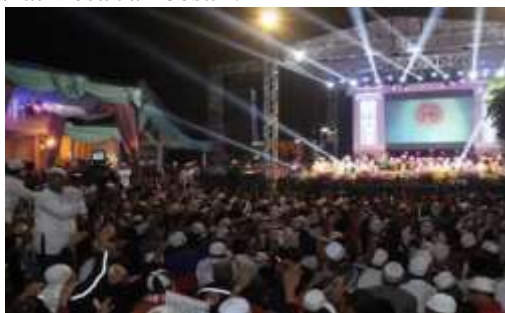
Gambar 1. Suasana Acara Shalawatan di Desa Jambesari dengan Panggung dan Iringan Musik Hadroh yang Dihadiri Ribuan Jamaah

Penyelenggaraan acara shalawatan ini melibatkan kelompok hadroh dan majelis keagamaan setempat dengan dukungan pemerintah desa. Kepala desa menyatakan bahwa pendekatan kultural-musikal dipilih karena terbukti efektif dalam menarik minat generasi muda: "Jika kita ingin anak-anak muda mencintai Nabi ﷺ, kita harus menggunakan cara yang mereka sukai" (Kepala Desa, wawancara, 2024). Berikut ini adalah gambaran suasana pelaksanaan acara shalawatan dengan iringan musik yang diselenggarakan oleh masyarakat Desa Jambesari.