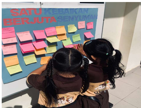
Gambar 4. Papan Apresiasi Kebajikan Siswa

Pelaksanaan sosialisasi tentang edukasi bullying di SDN 5 Panjer memperlihatkan bahwasanya metode pembelajaran yang menyertakan interaksi melalui ceramah dan diskusi dapat meningkatkan partisipasi siswa dalam pembelajaran. Keterlibatan yang aktif ini menjadi hal yang penting untuk memperbaiki pemahaman siswa tentang materi yang diajarkan. Ini sesuai dengan penelitian yang mengungkapkan bahwa psikoedukasi bullying dapat meningkatkan kesadaran, rasa empati, dan kemampuan sosial siswa untuk mencegah bullying di sekolah dasar (Rahayu, 2025).