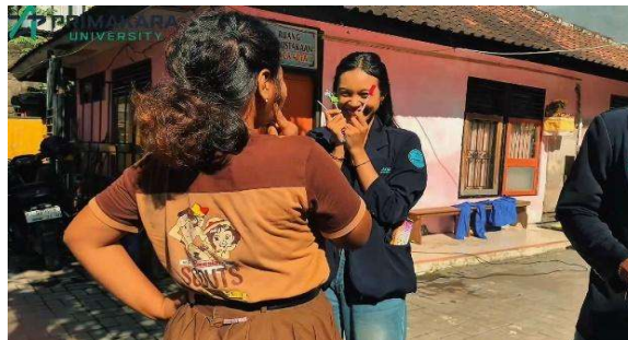
Gambar 3. Pemberian Apresiasi kepada Siswa atas Perilaku Positif

Kegiatan pemberian penghargaan kepada siswa yang menunjukkan sikap positif juga memberikan efek yang baik untuk mendorong siswa bertindak lebih baik. Melalui kegiatan ini, motivasi siswa menjadi lebih tinggi untuk menunjukkan sikap positif dalam kehidupan mereka sehari-hari. Proses pemberian apresiasi kepada siswa dapat dilihat pada Gambar 3.