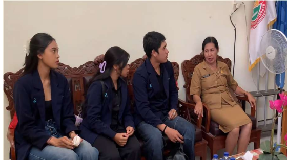
Gambar 1. Tahap Wawancara Permasalahan di SDN 5 Panjer

Pelaksanaan program pengabdian masyarakat yang berupa sosialisasi tentang dampak bullying di SDN 5 Panjer yang berjalan lancar sesuai dengan konsep yang direncanakan. Kegiatan ini dilakukan dengan cara berdiskusi yang didukung oleh media visual seperti poster. Selama kegiatan, para siswa menunjukkan semangat yang besar, terlihat dari keaktifan mereka dalam mengikuti materi, menjawab pertanyaan, dan berpartisipasi dalam diskusi. Pelaksanaan kegiatan sosialisasi secara langsung bisa dilihat pada Gambar 2.