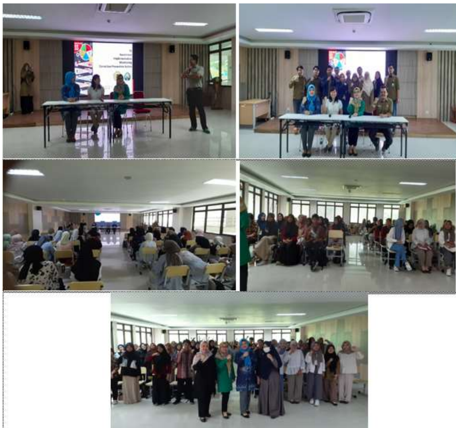
Gambar 4 pelaksanaan dan sosialisasi PKM 5 R dengan Mahasiswa dan dosen UNTIRTA

Kegiatan Pengabdian Masyarakat ini sudah dilakukan sesuai tahap yang di rencanakan dari awal di lakukan bersama tim, Dosen dan Mahasiswa. Pada Gambar 1 dan Gambar 2 adalah jalan nya kegiatan yang dilakukan pada saat PKM