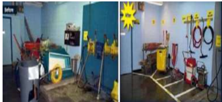
Gambar 2 Laboratorium teknik mesin sudah rapi