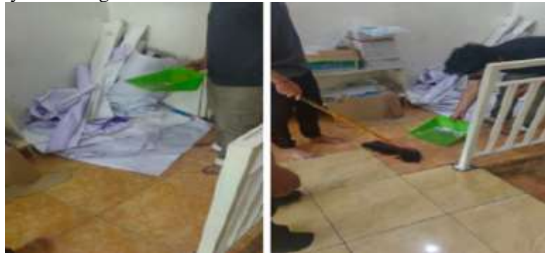
Gambar 1 ruang kerja yang sudah di susun rapi (pelaksanaan PKM)

Berikut ini foto kegiatan pelaksanaan PKM pentingnya 5 R di kampus Sindangsari Universitas Sultan Ageng Tirtayasa Serang