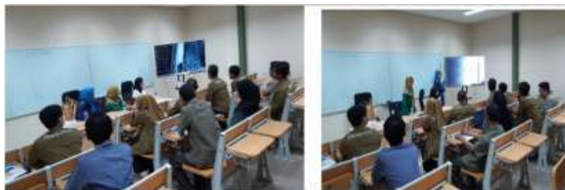
Gambar 3 sosialisasi dengan dosen dan tendik Universitas Sultan Ageng Tirtayasa