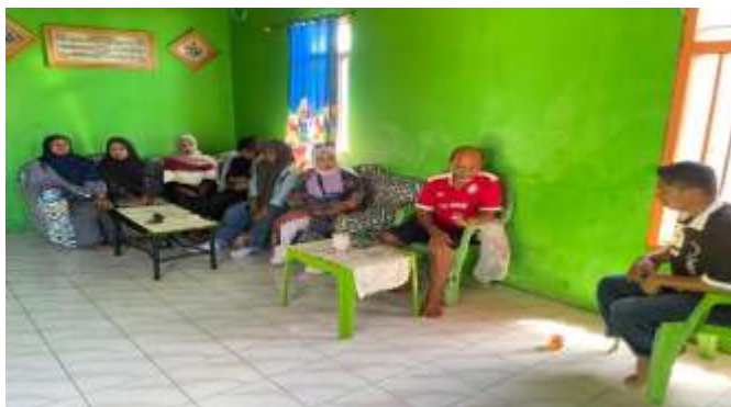
Gambar 1. Dokumentasi wawancara penelitian mengenai budaya Gaukan Bantilan di Pulau Lutungan, Kabupaten Tolitoli.

Pada Gambar 1. Hasil wawancara dan data lapangan tentang budaya di Pulau Lutungan menunjukkan adanya nilai-nilai kearifan lokal yang kuat, seperti tradisi Doja, yaitu kegiatan mendoakan warga dari rumah ke rumah setiap Jumat yang disertai pemberian sedekah berupa beras. Tradisi ini mencerminkan nilai religius, kepedulian sosial, dan solidaritas antar warga. Selain itu, sejarah asal-usul nama Pulau Lutungan juga mengandung nilai kearifan lokal yang menggambarkan hubungan manusia dengan alam, yaitu perpaduan unsur darat (pisang emas/lutu) dan laut (ikan teruntungan) sebagai identitas budaya masyarakat setempat. Temuan ini menunjukkan bahwa kearifan lokal tidak hanya berupa praktik sosial, tetapi juga melekat dalam identitas sejarah suatu wilayah.