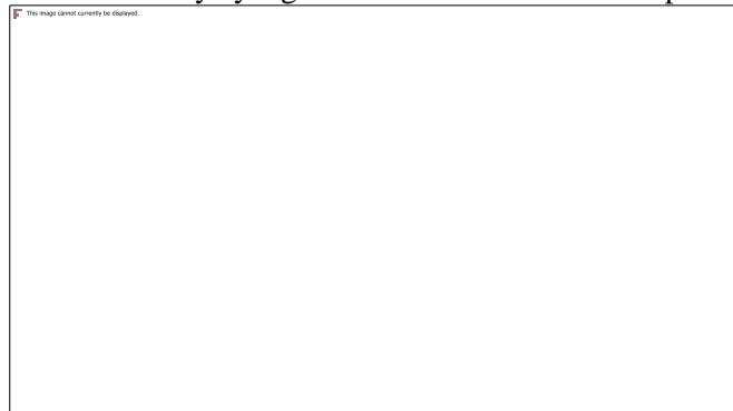
Gambar 3. Dokumentasi wawancara bersama narasumber budaya Gaukan Bantilan di Kabupaten Tolitoli

Pada gambar 3. Menunjukkan Budaya Gaukan Bantilan adanya nilai kepedulian sosial yang tinggi dalam kehidupan masyarakat. Hal ini terlihat dari kebiasaan berbagi hasil panen kepada warga, membantu masyarakat yang membutuhkan, serta keterbukaan pemimpin terhadap masyarakat sekitar. Tradisi tersebut mencerminkan sikap solidaritas dan rasa kebersamaan yang kuat. Nilai ini sangat relevan dengan tujuan pembelajaran IPS di sekolah dasar yang menanamkan sikap kerja sama, kepedulian, dan tanggung jawab sosial kepada peserta didik. Temuan tersebut sejalan dengan pendapat (Samiha & Aksara, 2025) yang menyatakan bahwa pembelajaran berbasis kearifan lokal dapat memperkuat karakter sosial siswa melalui pengenalan nilai budaya yang hidup dalam masyarakat.