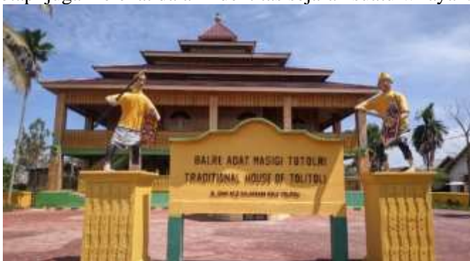
Gambar 2. Balai Adat Mogogutulan Tolitoli sebagai pusat pelestarian budaya lokal masyarakat Tolitoli

Pada Gambar 1. Hasil wawancara dan data lapangan tentang budaya di Pulau Lutungan menunjukkan adanya nilai-nilai kearifan lokal yang kuat, seperti tradisi Doja, yaitu kegiatan mendoakan warga dari rumah ke rumah setiap Jumat yang disertai pemberian sedekah berupa beras. Tradisi ini mencerminkan nilai religius, kepedulian sosial, dan solidaritas antar warga. Selain itu, sejarah asal-usul nama Pulau Lutungan juga mengandung nilai kearifan lokal yang menggambarkan hubungan manusia dengan alam, yaitu perpaduan unsur darat (pisang emas/lutu) dan laut (ikan teruntungan) sebagai identitas budaya masyarakat setempat. Temuan ini menunjukkan bahwa kearifan lokal tidak hanya berupa praktik sosial, tetapi juga melekat dalam identitas sejarah suatu wilayah.