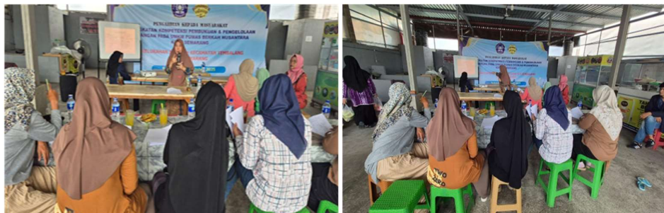
Gambar 2. Pelaksanaan Kegiatan Bersama para UMKM Pumasera Berkah Nusantara

Pada pelaksanaannya, kegiatan diikuti oleh 11 peserta. Ketidakhadiran sebagian peserta disebabkan oleh kondisi tertentu, antara lain kepulangan ke daerah asal serta keterbatasan operasional usaha. Beberapa peserta juga diwakili oleh anggota keluarga yang turut terlibat dalam pengelolaan usaha.