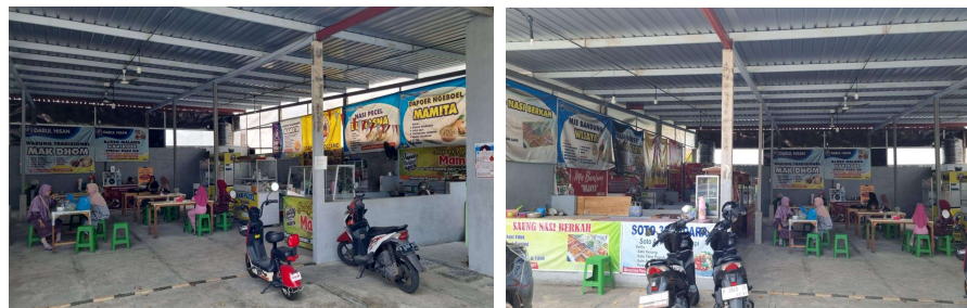
Gambar 1. Kondisi kluster kuliner UMKM Pumasera Berkah Nusantara

Dalam konteks ini, UMKM Pumasera Berkah Nusantara sebagai objek sasaran dalam pengabdian kepada masyarakat berlokasi di Jalan Dinar Mas Raya Blok BX 25 – 27, Kelurahan Meteseh, Kecamatan Tembalang. UMKM Pumasera Berkah Nusantara merupakan usaha mikro yang berfokus pada jenis usaha kuliner. Berlokasi di area strategis dekat kawasan pendidikan dan pemukiman di daerah Tembalang, UMKM ini memiliki akses pasar yang potensial dari kalangan mahasiswa, pegawai, dan masyarakat sekitar. UMKM Pumasera Berkah Nusantara berorientasi pada pengembangan produk halal dan terstandarisasi: rencana ke depannya UMKM ini menawarkan produk bersertifikat halal yang dapat menjangkau segmen pasar muslim yang luas. Selain itu kualitas dan keunikan produk memiliki ciri khas tersendiri yang mampu bersaing dengan kompetitor. UMKM ini telah memiliki basis pelanggan lokal yang setia dan memberikan ulasan positif.