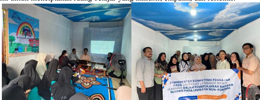
Gambar 1. Rangkaian Kegiatan Pengabdian

Materi terakhir pada hari pertama adalah pengantar Reader-Response Theory yang menekankan pentingnya interpretasi personal siswa terhadap teks. Melalui kutipan dari Louise Rosenblatt, narasumber mengajak peserta memahami bahwa makna tidak melekat secara tetap pada teks, melainkan muncul dari interaksi antara pembaca dan teks. Dalam kegiatan ini, peserta diminta membaca cerita pendek The Little Match Girl dan menuliskan refleksi pribadi, yang kemudian dibagikan dalam kelompok diskusi. Berbagai respons emosional dan pengalaman pribadi muncul, menunjukkan bahwa tutor mampu mengakses sisi afektif dari teks, dan mulai menyadari potensi metode ini untuk menciptakan ruang belajar yang inklusif, empatik, dan reflektif.