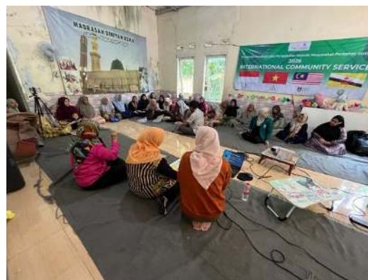
Gambar 3. Suasana pemaparan materi dan diskusi interaktif mengenai pengelolaan sampah dan bank sampah bersama masyarakat Desa Ligarmukti.

Infografis pada Gambar 2 disusun secara kontekstual sesuai dengan kondisi lingkungan Desa Ligarmukti yang berada di wilayah dataran tinggi dan memiliki potensi risiko longsor. Materi edukasi tidak hanya menjelaskan jenis-jenis sampah dan cara pemilahannya, tetapi juga menampilkan dampak negatif kebiasaan membakar sampah dan membuang sampah tanpa pemilahan terhadap kondisi lingkungan sekitar. Selain itu, infografis juga menjelaskan langkah sederhana pengelolaan sampah rumah tangga, pengolahan sampah organik menjadi kompos, serta mekanisme bank sampah sebagai sarana peningkatan nilai ekonomi masyarakat. Penggunaan media visual berbasis lokal tersebut membantu masyarakat memahami hubungan antara pengelolaan sampah, kebersihan lingkungan, dan upaya pencegahan risiko lingkungan di desa. Proses penyampaian materi dilakukan secara interaktif melalui sesi pemaparan dan diskusi bersama masyarakat Desa Ligarmukti. Dalam kegiatan tersebut, peserta diberikan pemahaman mengenai pengelolaan sampah rumah tangga, dampak lingkungan akibat sampah, serta mekanisme pengelolaan bank sampah berbasis masyarakat.