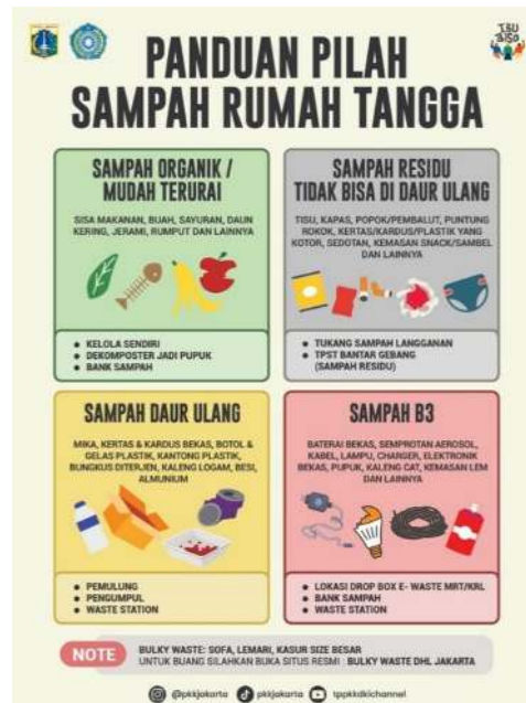
Gambar 1. Poster panduan pilah sampah rumah tangga yang digunakan dalam kegiatan sosialisasi pengelolaan sampah kepada masyarakat Desa Ligarmukti.

Dalam kegiatan pengabdian masyarakat ini membahas cara-cara memilah sampah di rumah seperti sampah organik, sampah anorganik, sampah sisa, dan sampah berbahaya. Selain itu, membahas perbedaan di antara masing-masing jenis sampah tersebut serta cara yang tepat untuk mengelolanya. Sebagai contoh, pada kegiatan ini menjelaskan proses mengubah sampah organik menjadi kompos. Membahas cara mendaur ulang botol plastik, karton, dan kaleng dengan menyerahkannya ke fasilitas daur ulang setempat, yang berpotensi menghasilkan pendapatan dalam prosesnya. Mengenai sampah sisa dan berbahaya, menjelaskan perlunya pengelolaan khusus untuk melindungi ekosistem. Tujuannya adalah untuk menjelaskan pentingnya memilah sampah rumah tangga, karena hal ini merupakan langkah awal menuju masa depan yang lebih bersih dan berkelanjutan. Media edukasi mengenai pemilahan sampah rumah tangga digunakan sebagai sarana pendukung dalam kegiatan sosialisasi kepada masyarakat Desa Ligarmukti. Poster tersebut memuat penjelasan mengenai jenis-jenis sampah beserta cara penanganannya agar masyarakat lebih mudah memahami proses pemilahan sampah sejak dari rumah.