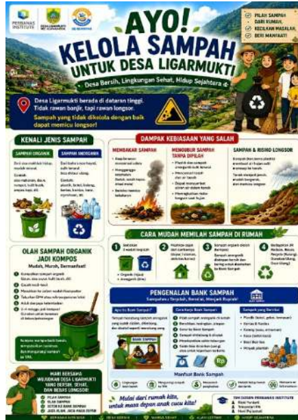
Gambar 2. Infografis edukasi pengelolaan sampah dan pengenalan bank sampah yang digunakan dalam kegiatan sosialisasi kepada masyarakat Desa Ligarmukti.

Infografis pada Gambar 2 disusun secara kontekstual sesuai dengan kondisi lingkungan Desa Ligarmukti yang berada di wilayah dataran tinggi dan memiliki potensi risiko longsor. Materi edukasi tidak hanya menjelaskan jenis-jenis sampah dan cara pemilahannya, tetapi juga menampilkan dampak negatif kebiasaan membakar sampah dan membuang sampah tanpa pemilahan terhadap kondisi lingkungan sekitar. Selain itu, infografis juga menjelaskan langkah sederhana pengelolaan sampah rumah tangga, pengolahan sampah organik menjadi kompos, serta mekanisme bank sampah sebagai sarana peningkatan nilai ekonomi masyarakat. Penggunaan media visual berbasis lokal tersebut membantu masyarakat memahami hubungan antara pengelolaan sampah, kebersihan lingkungan, dan upaya pencegahan risiko lingkungan di desa. Proses penyampaian materi dilakukan secara interaktif melalui sesi pemaparan dan diskusi bersama masyarakat Desa Ligarmukti. Dalam kegiatan tersebut, peserta diberikan pemahaman mengenai pengelolaan sampah rumah tangga, dampak lingkungan akibat sampah, serta mekanisme pengelolaan bank sampah berbasis masyarakat.