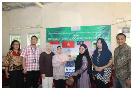
Gambar 5. Penyerahan simbolis media edukasi dan dukungan kegiatan pengelolaan sampah kepada perwakilan masyarakat Desa Ligarmukti.

Selain sesi diskusi, dalam kegiatan ini juga membagikan materi edukatif seperti poster dan panduan tentang pengelolaan sampah rumah tangga dengan begitu dapat diharapkan alat-alat ini dapat memfasilitasi proses pembelajaran berkelanjutan bagi semua peserta setelah acara berakhir. Poster-poster tersebut memberikan informasi yang jelas mengenai pemilahan sampah, mengubah sisa makanan menjadi kompos, serta manfaat bank sampah bagi lingkungan dan keuangan pribadi.