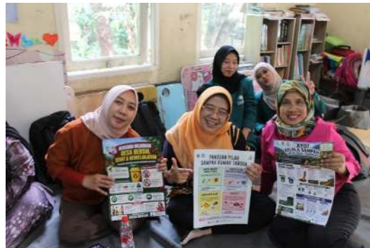
Gambar 4. Peserta kegiatan menunjukkan media edukasi pengelolaan sampah dan bank sampah yang dibagikan oleh tim pengabdian kepada masyarakat Desa Ligarmukti.

Dalam kegiatan pemaparan materi menggambarkan keterlibatan semua peserta dalam inisiatif penyuluhan. Kegiatan ini memastikan keterlibatan langsung dengan masyarakat dengan memfasilitasi diskusi yang memungkinkan semua peserta menyampaikan pendapat mereka. Tim pengabdian menjaga suasana percakapan yang santai, sehingga setiap orang merasa nyaman untuk mengajukan pertanyaan dan mendiskusikan pengalaman mereka sendiri terkait pengelolaan sampah di tempat tinggal masing-masing. Tujuannya adalah untuk menjelaskan pentingnya memilah sampah rumah tangga dan menumbuhkan antusiasme terhadap inisiatif bank sampah lokal. Mereka menunjukkan komitmen yang tulus untuk menjaga kebersihan di dusun dan memastikan pengelolaan sampah yang berkelanjutan di Ligarmukti. Diskusi terbuka ini memperkuat hubungan dengan masyarakat, sehingga informasi yang dapat disampaikan menjadi lebih mudah dipahami dan dapat ditindaklanjuti.