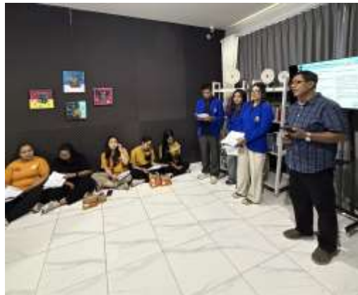
Gambar 2. Pelaksanaan Pelatihan Bahasa Inggris di PT. Bali Sundaram Travel

Tahap pelaksanaan pelatihan dilakukan melalui penyampaian materi secara interaktif. Materi diberikan secara bertahap agar peserta memahami hubungan antara kemampuan bahasa, pemahaman budaya, dan penggunaan teknologi dalam penanganan keluhan wisatawan internasional. Pelatihan yang dilakukan dengan melibatkan 3 dosen dari bidang ilmu yang berbeda dan 2 mahasiswa. Keterlibatan mahasiswa bertujuan untuk mendampingi karyawan selama proses pelatihan agar kegiatan dapat berjalan dengan maksimal.