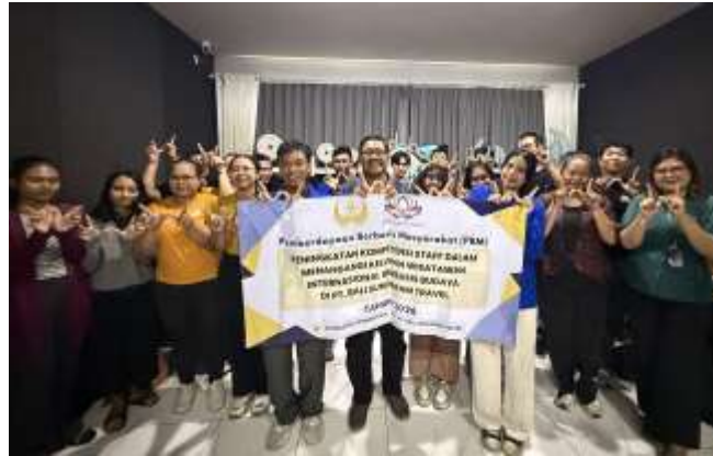
Gambar 3. Foto bersama setelah pelatihan

Tahap terakhir yaitu melaksanakan monitoring dan evaluasi terhadap karyawan. Pemantauan secara berkala dilakukan pada tahap akhir untuk melihat keberhasilan pelatihan pada bulan-bulan selanjutnya. Pada tahap evaluasi ini dilakukan perbandingan kemampuan awal yang dimiliki oleh karyawan yang diperoleh dari hasil kuesioner sebelumnya dalam bentuk pre-test dan post-test. Hasil dari evaluasi tersebut dituangkan dalam bentuk grafik untuk mempermudah melihat keberhasilan dan capaian dari program pelatihan ini.