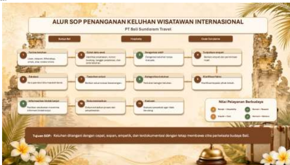
Gambar 4. SOP Penanganan keluhan wisatawan PT. Bali Sundaram Travel

SOP penanganan keluhan wisatawan internasional disusun untuk membantu staf menangani keluhan secara sistematis, profesional, empatik, dan berbasis budaya. Dalam konteks pelayanan travel agent, keluhan dapat muncul karena berbagai hal, seperti keterlambatan penjemputan, perubahan itinerary, kendala hotel, makanan yang tidak sesuai, masalah transportasi, biaya tambahan, pelayanan guide, maupun kurangnya informasi mengenai budaya lokal. Oleh karena itu, staf perlu memiliki alur kerja yang jelas agar setiap keluhan dapat ditangani dengan cepat, tepat, dan tetap menjaga kenyamanan wisatawan.