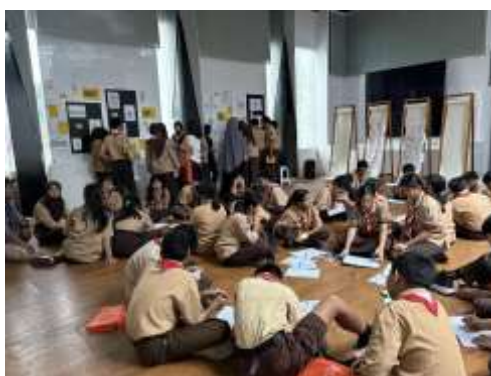
Gambar 2. Kegiatan workshop Sketsa

Rangkaian kegiatan Kota dalam sketsa menghasilkan beberapa capaian penting dalam konteks pengabdian kepada masyarakat. Pertama, kegiatan berhasil menjadi media pembelajaran kreatif bagi pelajar dalam mengenali Kota Tangerang Selatan. Melalui workshop sketsa, peserta diajak untuk tidak hanya melihat kota secara sepintas, tetapi juga mengamati bentuk bangunan, suasana ruang, dan karakter tempat. Proses ini membantu peserta memahami bahwa kota tersusun dari berbagai elemen visual dan pengalaman ruang yang dapat dibaca melalui pengamatan.