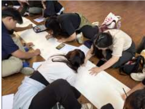
Gambar 4. Kegiatan Sketsa Bersama

Keempat, kegiatan menghasilkan karya kolektif berupa sketsa dan kolase tentang Kota Tangerang Selatan. Karya-karya tersebut tidak hanya memiliki nilai artistik, tetapi juga merekam persepsi generasi muda terhadap kota. Dalam kegiatan sketsa pada 31 Januari 2026, peserta menggambarkan tempat-tempat berkesan seperti Broadway Alam Sutera, Angkringan Pak Kece, dan jalur pedestrian di The Breeze . Hal ini menunjukkan bahwa ruang kota yang berkesan bagi pelajar tidak selalu berupa bangunan monumental, tetapi juga ruang aktivitas sehari-hari yang memiliki suasana, pengalaman sosial, dan identitas visual.