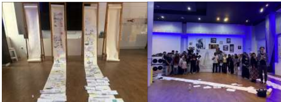
Gambar 5 dan 6. Hasil Kolase dan Sketsa Bersama

Kelima, kegiatan ini memperlihatkan bahwa sketsa dan kolase dapat digunakan sebagai metode partisipatif dalam pengembangan kota. Melalui media visual, aspirasi pelajar dapat ditangkap secara lebih spontan dan imajinatif. Dalam lampiran kegiatan, rangkaian workshop menghasilkan gagasan mengenai kota yang ramah pejalan kaki, kaya ruang hijau, memiliki ruang nongkrong kreatif, berbasis teknologi kota pintar, serta aman dan inklusif.