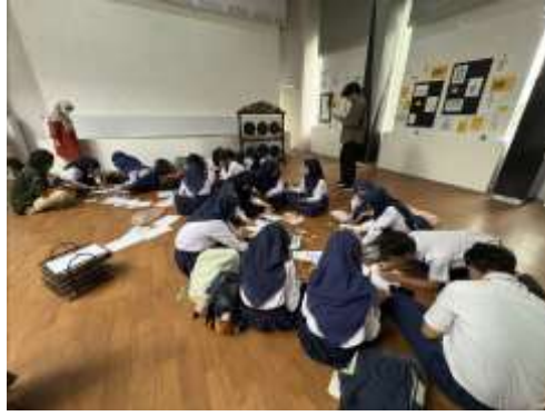
Gambar 3. Kegiatan workshop Kolase

Keempat, kegiatan menghasilkan karya kolektif berupa sketsa dan kolase tentang Kota Tangerang Selatan. Karya-karya tersebut tidak hanya memiliki nilai artistik, tetapi juga merekam persepsi generasi muda terhadap kota. Dalam kegiatan sketsa pada 31 Januari 2026, peserta menggambarkan tempat-tempat berkesan seperti Broadway Alam Sutera, Angkringan Pak Kece, dan jalur pedestrian di The Breeze . Hal ini menunjukkan bahwa ruang kota yang berkesan bagi pelajar tidak selalu berupa bangunan monumental, tetapi juga ruang aktivitas sehari-hari yang memiliki suasana, pengalaman sosial, dan identitas visual.