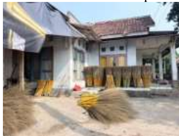
Gambar 2. Area Pengerjaan dan Penyimpanan Bahan Baku Sapu Lidi