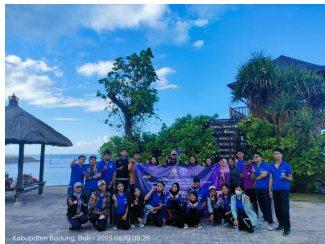
Gambar 6. Foto Pelaksanaan beach clean up dengan mahasiswa sebelum pelatihan