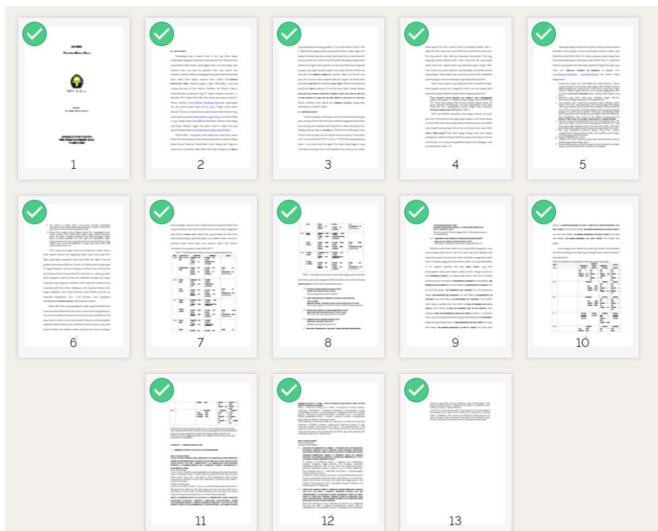
Gambar 2. Screenshot Rusiian for Tourism, yang dibuat oleh Tim Pengabdian PNBMETODE

Upaya untuk melaksanakan pembangunan sumber daya manusia yang berpusat pada rakyat dilakukan melalui pemberdayaan. Pemberdayaan masyarakat pada prinsipnya merupakan upaya untuk mengubah keberadaan masyarakat menjadi lebih mandiri, produktif dan sejahtera. Sesuai dengan kondisi mitra yang memiliki keterbatasan pada sumber daya manusia untuk mengelola manajemen BUMLem, maka pada program pemberdayaan masyarakat skema PKM kolaboratif, program kerja pada BUMLem Batu Rumbuk dilaksanakan pada tanggal 29 April 2023 bertempat Lembang Ma'kuanpare Kecamatan Rantebua Kabupaten Toraja Utara.