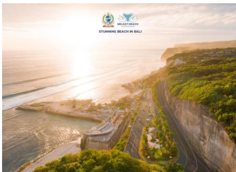
Gambar 1. Pantai Melasti

Desa Adat Ungasan selaku pengelola Desa Wisata Pantai Melasti Ungasan merupakan salah satu desa yang secara geografis terletak paling selatan Pulau Bali (kaki Pulau Bali) terdiri atas hamparan lahan perbukitan kering berkapur yang tandus. Potensi pertanian hampir tidak ada karena ketiadaan sumber air irigasi sepanjang tahun. Karena berada paling selatan Bali maka Ungasan memiliki batas alam alamiah berupa hamparan tebing curam dengan bentang pantai pasir putih yang cukup luas salah satunya Pantai Melasti. Secara demografis terdiri atas kurang lebih 2.639 KK dengan hampir 7.700 jiwa. Desa Adat Ungasan dipimpin oleh seorang Bendesa Adat (Kepala Desa Adat yang saat ini dijabat oleh Jero Bendesa Bpk I Wayan Disel Astawa, SE) dengan jajaran pengurus lainnya (prajuru adat) dan secara geografis terbagi atas 15 Banjar Adat (lingkungan) yang masing-masing dipimpin oleh Kelian Banjar Adat (kepala lingkungan adat) (Sari, 2018).