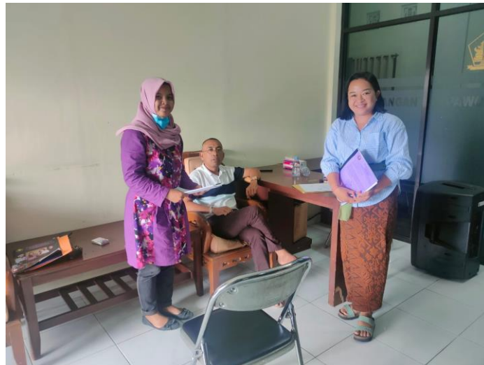
Gambar 5. Foto Persetujuan pelaksanaan kegiatan dengan Mitra

Berikut ini dokumentasi pelaksanaan kegiatan pengabdian di Pantai Melasti Desa Ungasan, yang dilakukan oleh tim pelaksana kegiatan pengabdian.