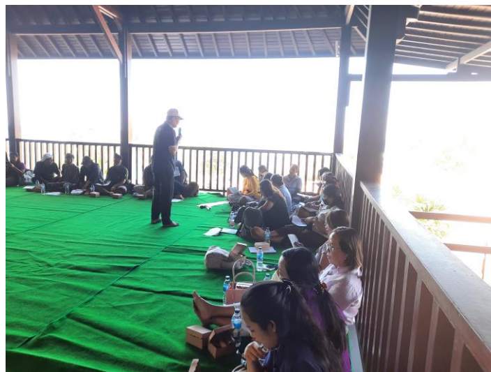
Gambar 8. Foto saat Pelatihan