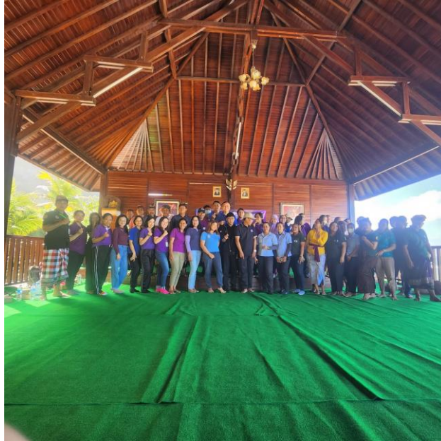
Gambar 7. Foto Peserta Pelatihan