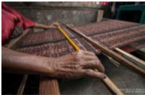
Gambar 4. Tenun Ikat