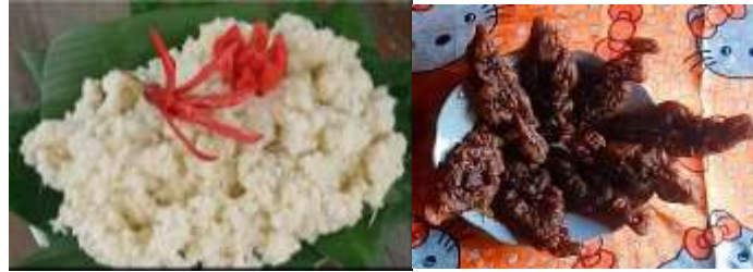
Gambar 7. Makanan Khas