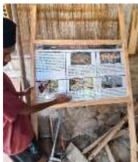
Gambar 1. Papan Informasi

Proses pembuatan papan informasi sejarah budaya berjalan dengan lancar. Kami bekerja sama dengan pihak mebel serta pemerintah desa untuk memastikan desain sesuai dengan identitas Desa Ndondo. Papan dibuat menggunakan bahan yang kuat dan tahan cuaca, dengan tulisan yang jelas dan mudah dibaca.