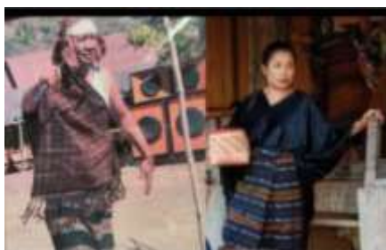
Gambar 6. Pakaian Adat

Lawo Lambu untuk Perempuan dan Ragi untuk Laki-laki. Lawo lambu adalah pakaian berupah saruh tenun (Lawo) dan atasan sederhana (Lambu). Sedangkan Ragi adalah sarung berwarna-warni. Pakaian ini sering digunakan dalam acara adat dan sebagai symbol identitas Budaya.