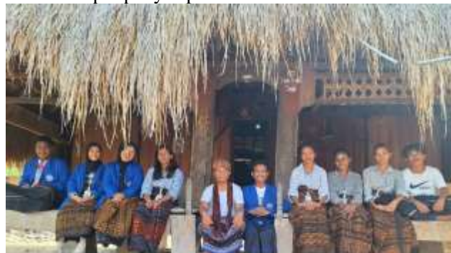
Gambar 8. Rumah Adat

Mosalaki (Rumah Kepala Suku/Ketua Adat), Sao Ria (Rumah adat perempuan) dan Sao Keda (Rumah adat laki-laki). Bangunan-bangunan ini yang dikenal secara kolektif sebagai Sao Nggua atau Rumah Adat. Tidak hanya berfungsi sebagai tempat tinggal tetapi juga sebagai pusat kegiatan adat, upacara dan tempat penyimpanan benda-benda warisan leluhur.