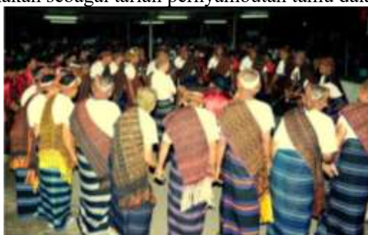
Gambar 5. Tarian Tradisional

Tarian Gawi dan Wedho Wanda, keduanya merupakan tarian khas suku Lio Ende yang sangat terkenal dan sering dipertunjukkan dalam berbagai upacara adat dan festival di wilayah Tersebut. Tari Gawi mengungkapkan rasa syukur dan persatuan masyarakat. Sedangkan Tari Wanda Pa'u sering digunakan sebagai tarian penyambutan tamu dalam upacara adat.