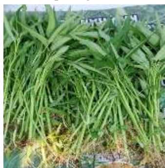
Gambar 2. Hasil pertanian semi hidroponik dan irigasi tetes

Kegiatan ini dilakukan terkait dengan penggunaan sistem pertanian semi hidroponik. Para petani dapat membandingkan hasil dari sistem semi hidroponik dan irigasi tetes sama hasilnya dengan yang dikerjakan di lahan tanah. Hasilnya dapat dilihat pada gambar berikut: