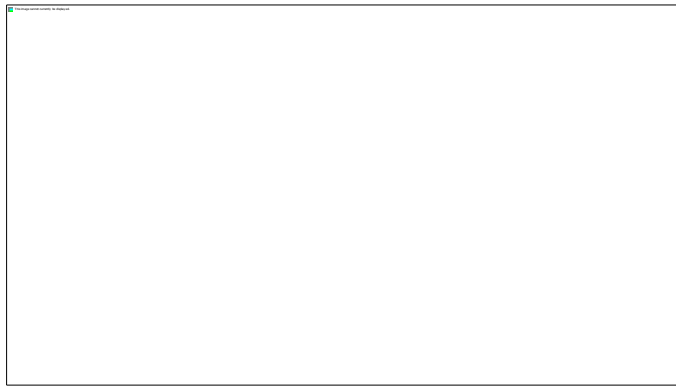
Gambar 1. Foto Seminar Materi dan Narasumber secara tatap muka di Kecamatan Setia Budi Jakarta Selatan

Dengan demikian secara normatif, perlindungan anak dari segala bentuk kekerasan termasuk perundungan telah dijamin dalam Undang-Undang Nomor 35 Tahun 2014 yang menegaskan bahwa setiap anak berhak memperoleh perlindungan dari kekerasan fisik, psikis, diskriminasi, dan perlakuan salah lainnya. Oleh karena itu, pencegahan bullying merupakan tanggung jawab bersama keluarga, sekolah, masyarakat, dan pemerintah.