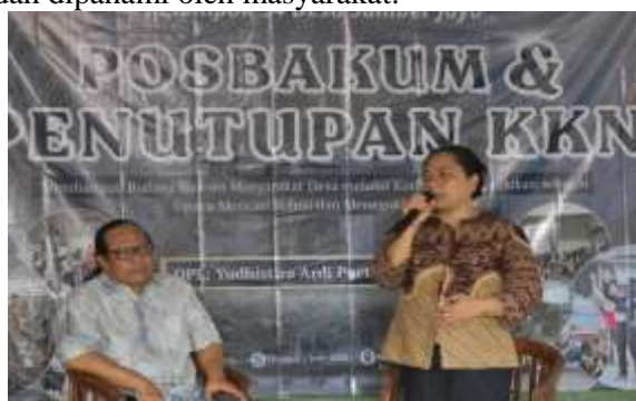
Gambar 3. Edukasi Hukum oleh Narasumber

Pada tahap pelaksanaan inti, kegiatan edukasi hukum dipandu oleh narasumber yang memiliki latar belakang pendidikan Magister Hukum (M.H.) dan kompetensi di bidang regulasi siber. Kehadiran narasumber memberikan penguatan akademis sekaligus praktis terhadap materi yang disampaikan sehingga peserta tidak hanya memperoleh pemahaman teoritis, tetapi juga gambaran nyata mengenai berbagai bentuk pelanggaran hukum di ruang digital. Materi edukasi difokuskan pada empat isu utama, yaitu penipuan berbasis Artificial Intelligence (AI), etika dan konsekuensi hukum penggunaan media sosial berdasarkan UU ITE, bahaya pinjaman online ilegal, serta dampak sosial dan ekonomi dari judi online . Penyampaian materi dilakukan secara interaktif dengan memanfaatkan media visual dan contoh kasus nyata agar lebih mudah dipahami oleh masyarakat.