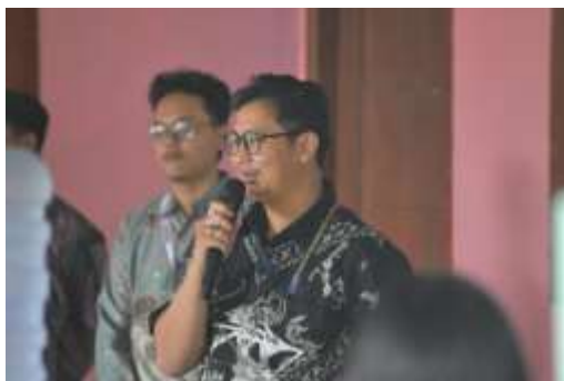
Gambar 1. Sambutan oleh Dosen Pembimbing Lapangan