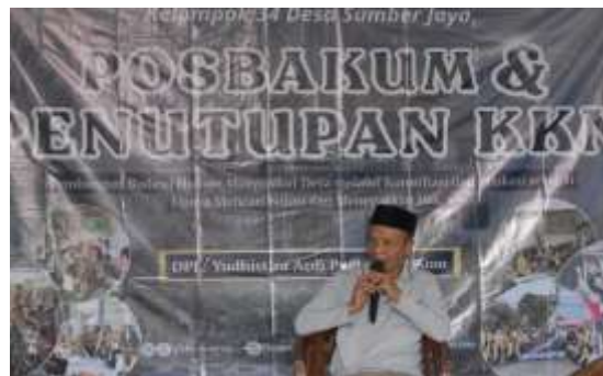
Gambar 2. Sambutan oleh Perwakilan Desa Sumber Jaya RW 037

Pada tahap pelaksanaan inti, kegiatan edukasi hukum dipandu oleh narasumber yang memiliki latar belakang pendidikan Magister Hukum (M.H.) dan kompetensi di bidang regulasi siber. Kehadiran narasumber memberikan penguatan akademis sekaligus praktis terhadap materi yang disampaikan sehingga peserta tidak hanya memperoleh pemahaman teoritis, tetapi juga gambaran nyata mengenai berbagai bentuk pelanggaran hukum di ruang digital. Materi edukasi difokuskan pada empat isu utama, yaitu penipuan berbasis Artificial Intelligence (AI), etika dan konsekuensi hukum penggunaan media sosial berdasarkan UU ITE, bahaya pinjaman online ilegal, serta dampak sosial dan ekonomi dari judi online . Penyampaian materi dilakukan secara interaktif dengan memanfaatkan media visual dan contoh kasus nyata agar lebih mudah dipahami oleh masyarakat.