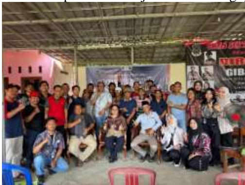
Gambar 4. Foto bersama antara mahasiswa, narasumber, dan warga desa Sumber Jaya Rw 037

masyarakat menjadi lebih memahami bahwa Posbakum tidak hanya berfungsi dalam penyelesaian perkara litigasi, tetapi juga dapat dimanfaatkan sebagai ruang edukasi, pendampingan, dan pengaduan awal terkait persoalan hukum digital. Optimalisasi fungsi Posbakum ini diharapkan mampu memperkuat perlindungan hukum masyarakat terhadap ancaman kejahatan teknologi yang terus berkembang.