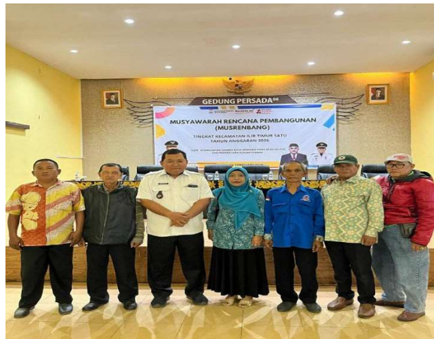
Gambar 1. Musyawarah perencanaan pembangunan tingkat kelurahan 20 ilir D.1 tahun 2025

Pada peraturan daerah (PERDA) nomor 4 tahun 2019 tentang pembentukan pemberdayaan masyarakat kelurahan (LPMK) pasal 6 yang dimana lembaga pemberdayaan masyarakat kelurahan (LPMK) selalu konsistensi dalam melaksanakan fungsi nya. Berikut adalah salah satu kegiatan musrembang yang di hadiri oleh lurah, LPMK, ketua RT/RW, ketua PKK dijelaskan pada gambar di bawah ini: