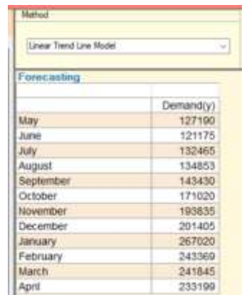
Gambar 5. Input Data Metode Tren Analysis Dengan Software POM-QM