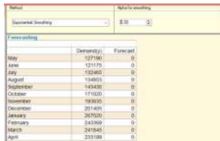
Gambar 3. Input Data Metode Exponential smoothing Dengan Software POM-QM