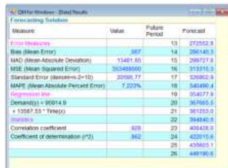
Gambar 6. Output Metode Trend Analysis Dengan Software POM-QM

Berikut rekapitulasi peramalan ( forecasting ) dengan software POM-QM.