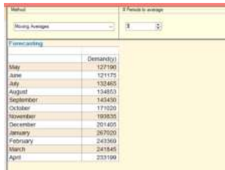
Gambar 1. Input Data metode Moving Averages Dengan Software POM-QM