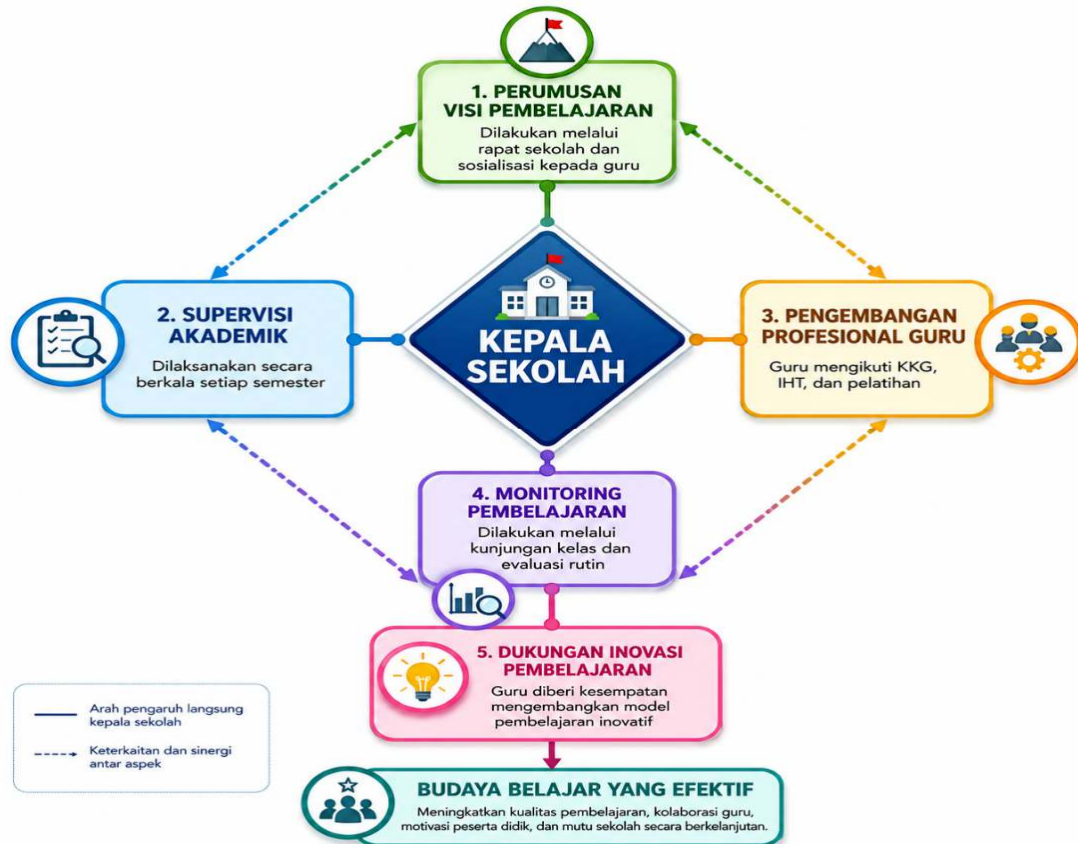
Gambar 1. Implementasi Kepemimpinan Pembelajaran di UPTD SD Negeri Ekam

Selain itu, kepala sekolah juga mendorong guru untuk mengikuti kegiatan Kelompok Kerja Guru (KKG), pelatihan Kurikulum Merdeka, serta berbagai kegiatan pengembangan kompetensi lainnya. Upaya tersebut menunjukkan bahwa kepemimpinan pembelajaran yang diterapkan berorientasi pada peningkatan kapasitas guru sebagai pelaksana utama proses pendidikan di sekolah